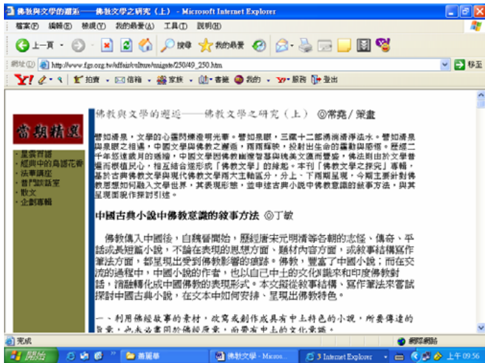
法鼓山《佛教文學與藝術學術研討會論文集》如圖：