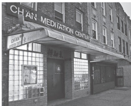
圖一：紐約皇后(Queens)區東初禪寺大門

1978年底聖嚴法師，首次在紐約皇后(Queens)區的林邊(Woodside)地租下一層房子，成立禪中心(Chan Meditation Center)，次年，為紀念師父東初老人，改名稱「東初禪寺」(The Chung-Hwa Institute of Buddhist Culture)。此時雖是道場固定，