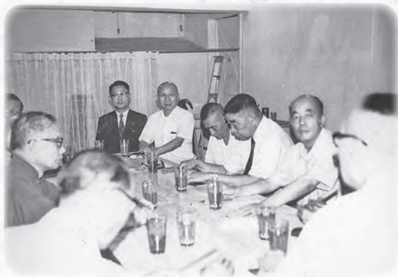
周老居士（右一）主持會議，討論推廣佛法