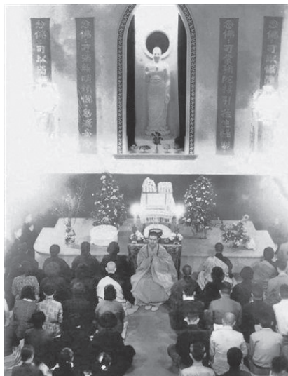
星雲大師（中）五十幾年前於宜蘭念佛會主持「彌陀佛七」法會。

所謂「吃果子拜樹頭」，佛教三藏十二部經，都是釋迦牟尼佛成道以後，不辭辛勞的講說，唯有追本溯源，佛教徒才能將正信的佛法發揚光大。因此，對於宣說這部《阿彌陀經》的佛陀，不禁要問：我們有認識他嗎？