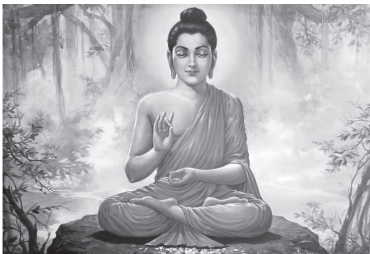
釋迦牟尼佛是人間的佛陀，是佛教的信仰中心。

派、哪一個國家、哪一個語系、哪一個路線來認識佛教，都應該以人間的佛陀為中心，佛陀的本懷就是包括所有宗派的人間佛教。