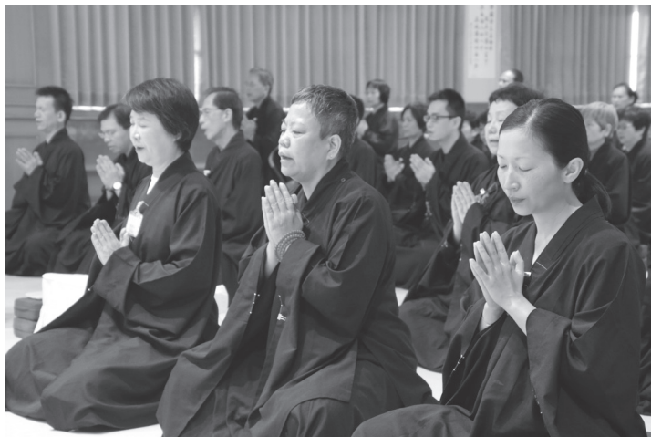
想往生極樂世界，念佛須一心不亂。

你昨天在哪裡受到驚嚇了，我也在旁邊念：「阿彌陀佛，阿彌陀佛！」我的意思叫你「不要怕，不要怕」。