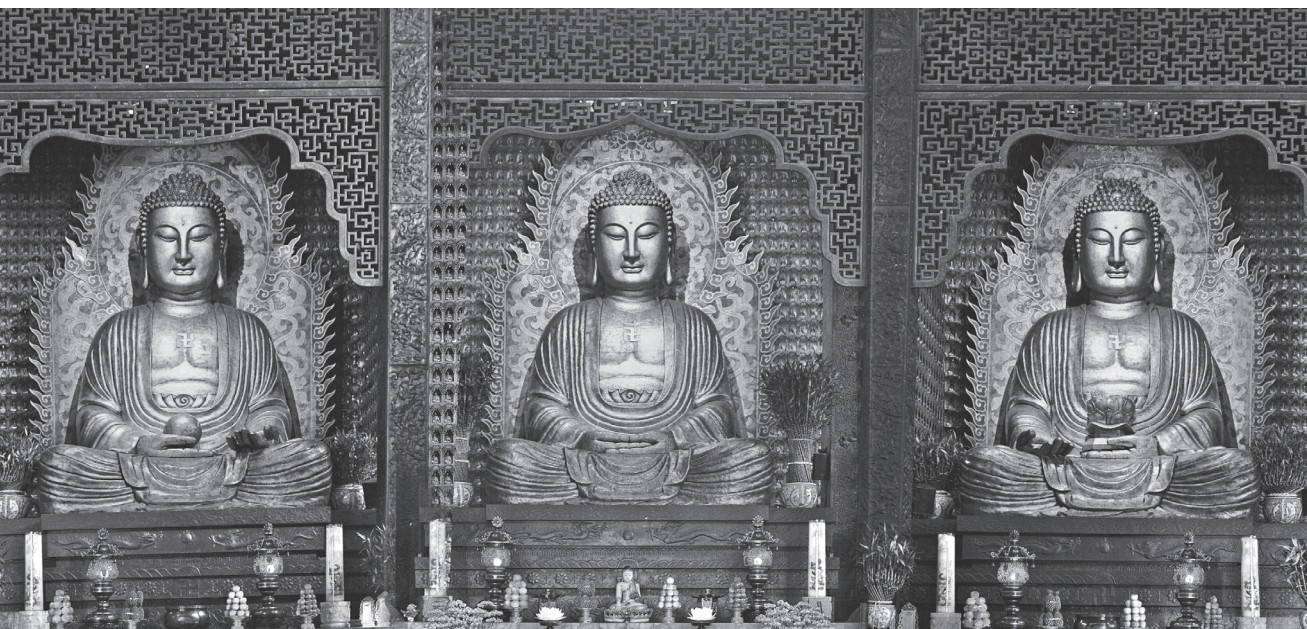
不論釋迦或彌陀，佛佛道同，所謂人間淨土、彌陀淨土，其實都是一家。圖為佛光山大雄寶殿三寶佛。

難得。我們說到西方極樂世界，等於我們移民到美國，到美國要有「良民證」，你到彌陀淨土要持什麼證，阿彌陀佛才會承認你呢？人間佛教就是一個證明。