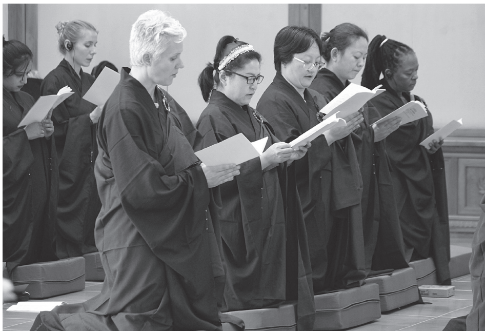
太虛大師特別強調在家菩薩受持五戒的重要性。圖為南非南華寺中外信眾皈依受戒。

守持五戒，人倫的道德無缺，取得人的資格。學菩薩應從做得是一個人起！否則，人格尚虧，菩薩的地位便無處安置。能行十善，便可進入從人而天。緣無貪無瞋無癡，其心境平靜清寧，已入於天人的境界。唯學菩薩者是在成佛，不求個己之享受為足，於人於天的境界中，更淬勵其智慧德行，淨化其他的大眾。菩薩是永與大眾為友，不捨大眾，於大眾中學習菩薩道。 23