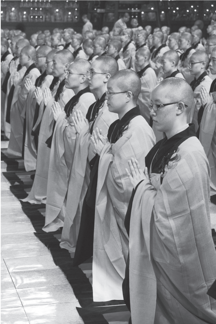
戒律是佛教一切修行的基礎。