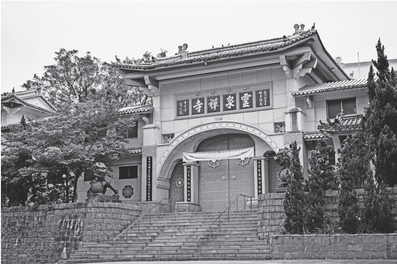
基隆靈泉禪寺大門