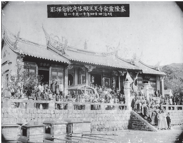
基隆月眉山靈泉禪寺1911年落成的天王殿

1909年11月11日，靈泉寺天王殿落成； 8 1917年9月，靈泉寺三座石塔落成； 9 1920年10月24日，新建開山堂落成，顏雲年賀詞道：「開山於此，垂二十年。高僧寶剎，名聞大千。斯堂構就，規模備焉。證果已成，可暫息肩。」 10 代表靈泉寺整個硬體建設告一段落。