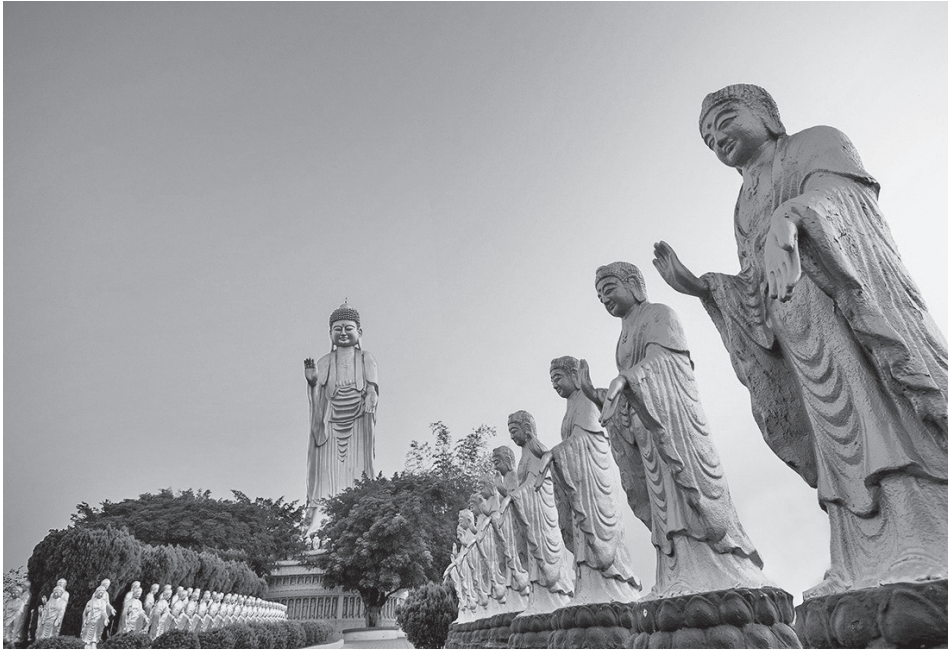
心中有佛，看到的是佛像而不是水泥。圖為佛光山大佛城一景。

的佛像都是水泥做的，是水泥文化。」我聽了十分訝異，為什麼我們多年來都只看到佛，沒有看到水泥；而他千里迢迢遠道而來，只看到水泥，沒有看到佛呢？這基本的關鍵在於心中有沒有「佛」的關係。