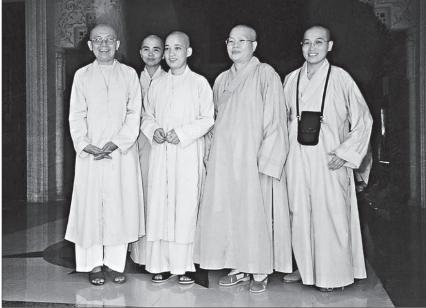
越南僧服（左一及左三）與台式長衫不同，顯現出越南特有的飄逸感。

1986年後，執政的越南共產黨開始改變經濟政策，以西方世界和亞洲四小龍（現在主要是中國大陸）為師，學習市場經濟的模式，使經濟有了穩健的成長，越南執政黨逐步舒緩了政治壓力。官方資料顯示，今日越南GDP年增長率為8.7%，為東亞第二，僅次於中華人民共和國，有人預言越南將成為繼金磚四國之後的第五塊金磚。