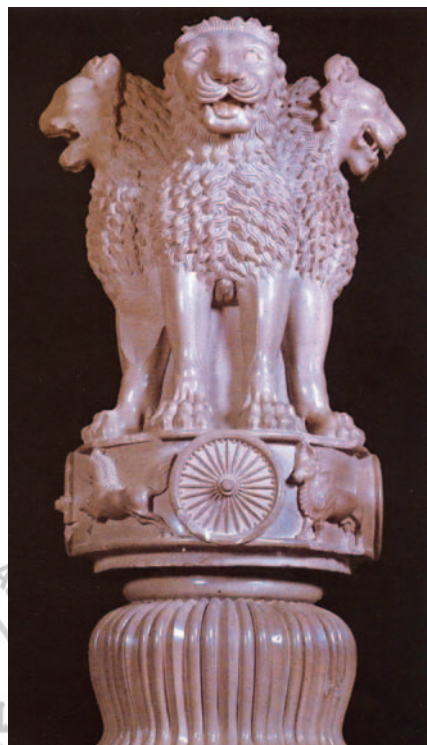
◎此阿育王石柱上的四獅柱頭，現正收藏於鹿野苑博物館中。也是印度的國徽，印度紙鈔上現今也以此四獅柱頭為印記。

公元前259年，阿育王開始接觸佛教，並以佛教的理念管理這個疆域遼闊、種族和宗教眾多，文化類型歧異很深的國家。阿育王弘揚佛教不遺餘力，不僅廣建寺塔扶植佛教，並直接參與僧團的活動。他派自己出家的兒子摩哂陀和公主僧伽