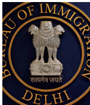
◎印度國徽也以阿育王石柱的石獅柱頭作為標記。

僧團建立從鹿野苑開始，佛法於焉流傳。而時間推移，人事更迭，阿育王在各地所建造的佛塔、石柱，縱使只剩廢墟殘址，佛教在歷史上還是留下了紀錄，便於人們尋訪和辨認，追思感念佛陀以及發生在佛陀周遭感人的故事。