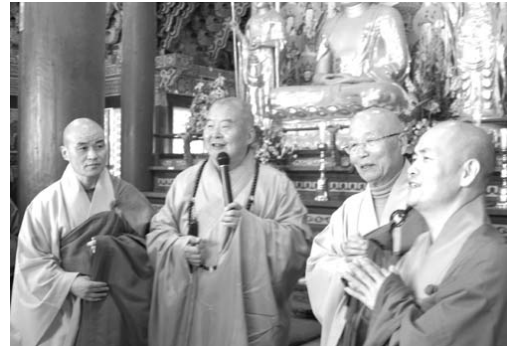
佛光山開山星雲大師（左二）應邀至松廣寺開示，左一為松廣寺住持永昭法師，右二為松廣寺方丈菩成長老，右一為翻譯大見法師。

繼一九九〇年佛光山開山星雲大師應邀到通度寺交流之後，二〇〇四年五月，大師再度應通度寺之邀前往韓國弘法。首先為通度寺傳授五戒、菩薩戒戒會中之五千名戒子開示，並對通度寺弘揚戒律之精神表示讚揚。此次弘法行程中，大師也被邀請到松廣寺、中央僧伽大學為大眾開示講演、座談。接著在參禮一山如來寺（通度寺分別院）時，大師邀請住持頂宇法師所組織的九龍寺、如來寺合唱團到佛光山參加「人間音緣」演唱會，以及頂宇法師的攝影作品來台灣巡迴展出之構想，其間更促成其傑出弟子性圓法師到美國西來大學授課之因緣。