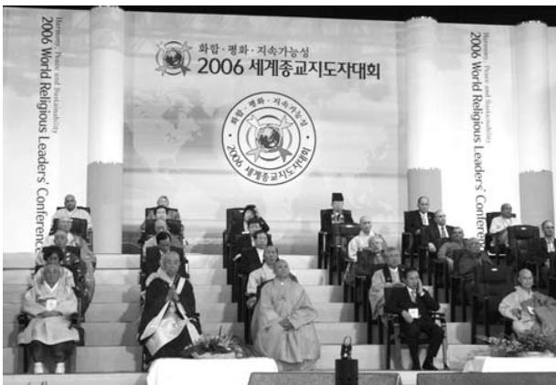
二〇〇六年萬海節——世界宗教領導人大會開幕式

二〇〇三年九月及二〇〇四年四月，佛光山開山星雲大師應韓國兄弟寺海印寺、通度寺之盛情邀約，二度赴韓展開系列弘法，堪稱近現代以來兩國佛教交流之盛事。二〇〇六年六月，韓國教界友人再度邀請大師前往首都首爾市參加慶祝韓國佛教東傳一六三四周年紀念「二〇〇六年萬海節——世界宗教領導人大會」，然因大師行程早已排定前往國際聯盟所在地——日內瓦，主持「日內瓦佛教會議中心」落成典禮而未克前往，遂指派佛光山都監院院長慧傳法師代理參加。