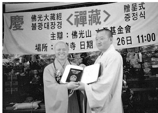
一九九五年，心定和尚（左）代表佛光山開山星雲大師將《佛光大藏經·禪藏》贈予韓國各大寺院及圖書館等二十三個單位（右為九龍寺住持頂宇法師）

由於佛光山文化出版品在當地受到肯定與歡迎，亦有大學院校將其作為佛學教材使用。為了便利使用者更方便查閱，當地更有將《佛光大辭典》之索引重新編排，製作成韓文版發行之創舉。此外，《佛光山三十週年特刊》及《普門雜誌》等，更成為教界、新聞各界藉以瞭解佛光山的重要參考資料之一。