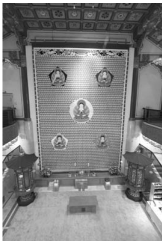
通度寺製作，並於聖寶博物館展出的「二〇〇六年世界足球盃曼陀羅掛佛幀」

現今的通度寺仍是韓國僧人受戒的重要戒壇之一。此外，通度寺也相當重視佛教文物的保護而設有「聖寶博物館」[註 2]，收藏並展示著慈藏律師的袈裟、多件國寶級文物，以及現代佛教藝術精品。二〇〇二年，通度寺特別策畫製作了一幅高十一 M、寬七·二三 M 的巨型掛畫——「通度寺世界足球盃曼陀羅掛佛幀」，紀念日、韓兩國於二〇〇二年聯合主辦「世界盃足球錦標賽」之友誼交流，同時也表達韓國民眾團結愛國，擁護國家舉辦世界活動的熱忱信念並祈求世界和平、發揚國家傳統文化的共願。整體圖像採以韓國傳統文化之色系，中央為象徵世界五大州的「五方佛」，表現出