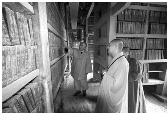
參觀海印寺安奉高麗大藏經的藏經閣

安奉高麗大藏經的藏經閣也是該寺的一大特色，其與八萬大藏經皆已正式登入世界文化遺產。整體建築並不採用任何先端科技來防潮，而是在地下埋設大量的鹽、木炭、石灰，以確保建物在任何氣候條件下防止腐朽、損毀及蟲蛀。藏經閣內窗戶大小互相對流，讓屋內保持通風，可以說是十五世紀建築的一大創舉。據《伽耶山海印寺誌》記載，從一六九五到一八七一年間，海印寺曾遭受七次祝融，僅有保存八萬大藏經的藏經閣仍完好如初。一八七二年以後，寺眾據地理及風俗勘察，發現大火皆由寺院對面一個多小時路程，一千零一十米高的「埋火山」蔓延而波及寺院。為了杜絕火事，寺院開始在每年端午節舉辦祈安法會，並於主殿大寂光殿等數處掘洞埋入三十公斤的鹽並攪之以水，同時在埋火山的中央及東、西、南、北方的地底埋藏鹽甕。端午節期間，寺院也會舉辦足球比賽，藉以讓僧眾鍛鍊體能，以隨時保持應變能力；此外，寺方每月十五日都會舉行消防演習、將藏經搬運至安全地方。自從埋下大量的鹽之