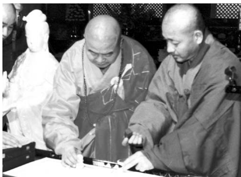
一九八二年十月，佛光山開山星雲大師（左）與通度寺住持性坡法師（右）假高雄文化中心締盟為兄弟寺

一九七五年，佛光山開山大師以「中日佛教關係促進會常務理事」之身分組團訪問日韓。在與韓國佛教界達成「促進中韓友誼」及「佛教文化交流」的共識下，於漢城簽署成立「中韓佛教促進會」，此後透過雙方多次積極互訪，為中韓佛教開啓了友誼的開端。一九八二年十月二十三日，值逢通度寺開山一千三百三十六周年