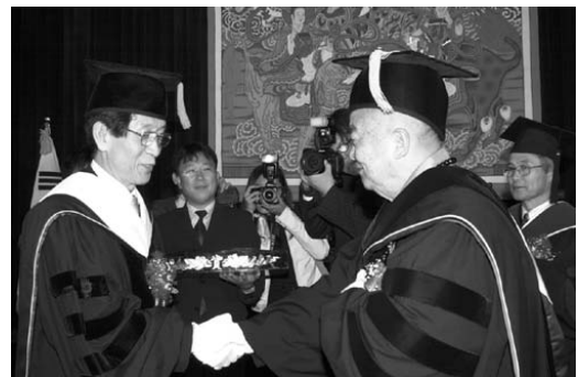
佛光山開山星雲大師（右）榮獲東國大學校長洪起三（左）頒授榮譽哲學博士學位

由於大師對當代全球佛教乃至促進人類和平具有重要貢獻及時代意義，東國大學特別在這次的行程中頒授榮譽哲學博士學位與大師。東國大學董事長玄海法師於會中表示：「這是韓國歷史上首次透過佛教與中華民國友好，這個因緣必能開展中韓佛教之親善交流。」隨後佛光山開山大師以「全球化時代中佛教的貢獻」為題，與東國大學洪啓三校長、西來大學 Lancaster 校長、南華大學陳森勝校長、佛光大學前任校長趙寧教授進行座談，針對戰爭與恐怖分子、自然環境破壞與生命輕視及佛教對世間生活和教育的影響提出建言。