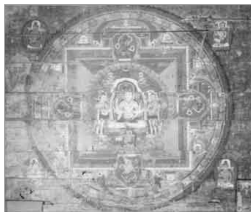
圖版十一：黑水城出土木版畫「佛頂尊聖曼荼羅圖」

黑水城出土的兩幅大型壇城木版畫更引人注目。木版畫為「佛頂尊聖曼荼羅圖」，高一三〇釐米，寬一〇八釐米，全圖是圓、方、小圓組成的壇城，中間是自佛頂尊聖，有三臉，每臉有三眼、八臂，分別在圖右下角繪男女供養人，可能是夫妻。畫底蘭色，有西夏文陀羅尼，此圖也是藏密畫風。[註 65] (圖版十一)