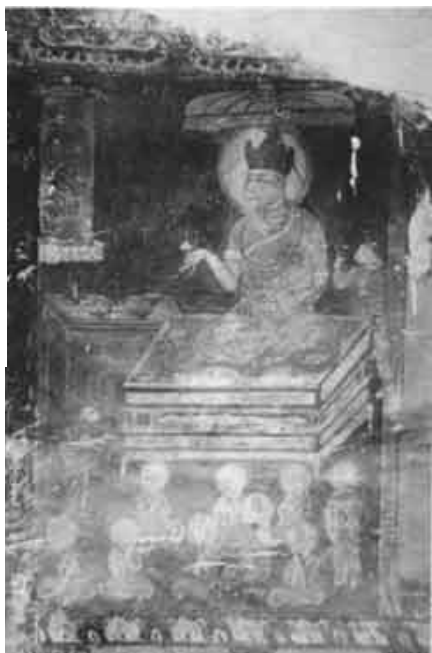
圖版一： 鮮卑國師說法圖

西夏的「國師」不僅是西夏皇帝之師名號，還是西夏管理佛教的機構兩種功德司正的正職。西夏可能很早就開始封設國師，在《文海寶韻》的序言中提到建國前就已經有國師院。據《天盛律令》知天盛年間每一功德司設六國師，可知當時國師較多。在遺存的文獻記載中發現國師不少，目前已輯錄到至少有二十四位西夏國師，二十六種封號。西夏的國師封號在歷朝國師封號中也算得上是十分豐富的。他們或管理司務，或傳譯佛經，或主持法事，在西夏佛教事務中發揮著重要作用。（圖版一）