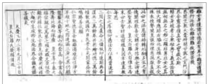
圖版九：漢文《佛說轉女身經》

仁宗去世後三年，即天慶三年（一一九六）皇太后羅氏又於「大祥之辰」，發願印施《大方廣佛華嚴經·入不思議解脫境界普賢行願品》許願在三年之中，作大法會燒結壇等三千三百五十五次，大會齋一十八次，開讀經文：藏經三百二十八藏，大藏經二百四十七藏，諸般經八十一藏，大部帙經並零經五百五十四萬八千一百七十八部，度僧西番、番、漢三千員，散齋僧三萬五百九十員，放神幡一百七十一口，散施八塔成道像淨除業障功德共七萬七千二百七十六幀，番漢《轉女身經》、《仁王經》、《行願經》共九萬三千部，數珠一萬六千八十八串，消演番、漢大乘經六十一部，大乘懺悔一千一百四十九遍，皇太后宮下應有私人盡皆捨放並作官人，散囚五十二次，設貧六十五次，放生羊七萬七百九十口，大赦一次。（圖版九）