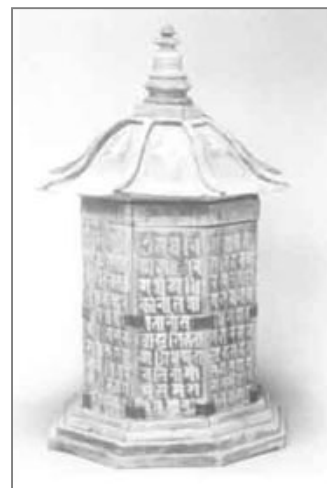
圖版二：甘肅武威西夏墓出土木緣塔

普通西夏僧人的墓葬比較簡單。著名的寧夏青銅峽一百零八塔應是僧人的墓塔，依山勢從上至下按奇數共有十二行，排列有序，形成總體平面呈三角形的巨大塔群。除第一行一座高五米外，其餘均在二·五米左右。可能是地位不等的僧人墓塔。寧夏賀蘭山麓發現了大型西夏塔群遺址，其中清理出的塔基六十二座。共發掘面積三六〇〇平方米，全部塔基都在賀蘭山拜寺溝口一側的扇形山坡上。這些塔在雙塔寺廟的近旁，有可能是大型寺廟僧人