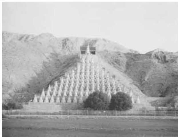
圖版三：寧夏青銅峽一百零八塔

的集中墓地。塔基殘高最高的僅〇·六米，低的只有十幾釐米，塔基大的直徑有三·五米，小的不足二米。塔基基座共有三種形制：十字剝角形、八角形、方形。其中十字剝角形最多，有五十七座，方形有三座，八角形僅二座。部分佛塔中築有塔心室。塔心室有方形、圓形兩種，有的與塔基底部在一個平面上，有的則低於塔基。其部分塔心室中發現了塔模、骨灰等遺物。塔心室不僅大小不一，而且所用材料也各不相同，有石砌的、有磚砌的，也有用土坯砌的。[註 39]也應是不同等級僧人有不同墓葬的反映。（圖版三）