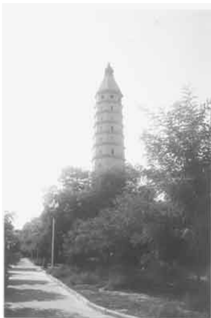
圖版六：寧夏銀川承天寺塔

西夏著名的承天寺是諒祚母后沒藏氏倡建，據記載：於西夏福聖承道三年（一〇五五）建成：「因中國所賜大藏經，役兵民數萬，相興慶府西偏起寺，貯經其中，賜額『承天』，延回鶻僧登座演經，沒藏氏與諒祚時臨聽焉。」[註 46]修建宏偉的承天寺，是一次浩大的工程，以至要動用「兵民數萬」。當時所作〈新建承天寺瘞佛頂骨舍利碣銘〉描繪了興建承天寺和