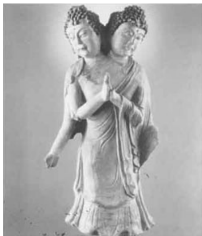
圖版十二：黑水城出土泥塑彩繪雙頭佛像

黑水城出土一尊雙身佛像，上身自胸部分開，雙頭分別向左右下方稍垂，頭頂有螺髻，佛面豐滿慈祥，身披袈裟，肩下有四臂，兩臂在胸前合十，另兩臂向左右下方伸展，造型十分奇特，世上稀有。[註 66]黑水城遺址附近的一個古廟中出土的二十五尊彩塑像，包括佛像、菩薩像、男女供養人像、力士像、化生童子像。它們雖然都是佛教塑像，但卻著力表現了現實生活中的人物，有濃郁的生活氣息，使人陶醉、神往。有人把它們和同時代太原晉祠中的宮女塑像相提並論，認為它們各有千秋，都是使人賞心悅目的藝術品。[註 67]（圖版十二）