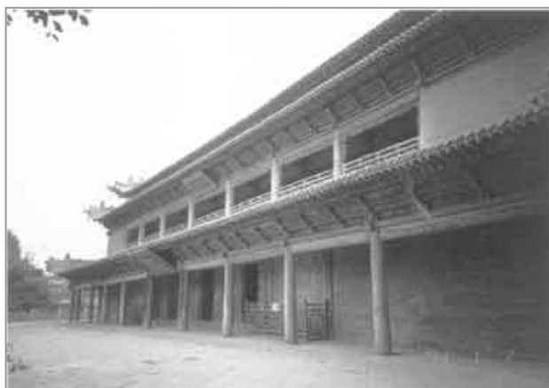
圖版七：甘肅張掖臥佛寺

崇宗時期另一件大規模修建寺廟的活動是在甘州建築臥佛寺。對此寺修建有兩種記載。據明宣宗〈敕賜寶覺寺碑記〉所載：西夏乾順時，有沙門族姓嵬咩（嵬名），法名思能，早先從燕丹國師學成佛理，受境內人崇敬，號為國師。他掘得古涅槃佛像後，在甘州興建大寺，時為崇宗永安元年（一〇九八），該寺就是留存至今的有名的臥佛寺。[註 50]又據《西夏書事》記載：乾順自母親梁氏死後，常供佛為母祈福。當時甘州僧人法淨聲稱。自己於張掖縣西南首浚山下夜望有光，掘得古佛三身，皆臥像，獻於乾順。乾順遂於貞觀三年（一一〇三）在甘州建宏仁壽，即後來的臥佛寺。[註 51]顯然，兩種說法在時間、人物、情節上都有差異。但兩說都認為甘州臥佛寺是在乾順時期興建的。甘州臥佛寺又名寶覺寺、宏仁寺，俗名大佛寺，座落在今甘肅省張掖縣城西南隅。寺內現存大佛殿一座，為木構建築，清乾隆年間重建。兩層樓，重檐歇山頂，面闊九間五十一·三米，進深七間二十六·七米。平面呈長方形，正中塑釋迦牟尼涅槃像一尊，身長三十四·五米，肩寬七·五米，木胎泥塑，金裝彩繪，比例勻稱適度，神態自然豐滿，原為西夏時塑造，明代曾為修補。臥佛身後有十大弟子塑像，南北兩側塑十八羅漢，皆為後代重修。寺內尚存藏經閣和一土塔。甘州臥佛寺是河西地區迄今所存最大的古建築之一。[註 52]（圖版七）