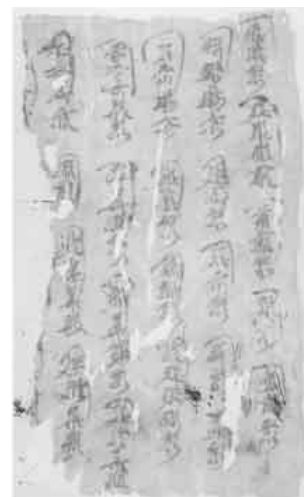
圖版八：黑水城出土西夏文僧人名單

在西夏城市建築中寺廟占有很大比重。西夏的黑水城遺址早已成死城，因此較多地保留了西夏和元代的城市建築格局。一九八三年、一九八四年內蒙古文物考古研究所全面勘測黑水城遺址，通過發掘可知當時黑水城城內寺廟很多，占地面積寬大。[註 53]西夏時期的建築歷經滄桑，早已毀壞殆盡，保存至今的完整寺廟再也難尋真跡。但隨著考古事業的發展，發現一些保存至今的佛塔屬西夏時期，它們各有特點，展現出西夏佛教建築的風采。（圖版八）