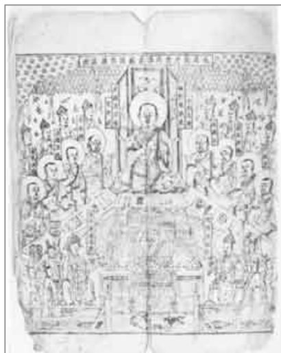
圖版四：中國國家圖書館藏西夏譯經圖

仁孝時期值得稱道的是佛經校勘。《過去莊嚴劫千佛名經》發願文中，在敘述了西夏譯經的情況後，接著提到了西夏校經的史實：「後奉護城皇帝敕，與南、北經重校。」護城皇帝即仁宗。「南經」當指西夏之前的宋本，即《開寶藏》。西夏以北的遼、金先後刻印了漢文大藏經，一為《契丹藏》，一為《趙城藏》。此時均先後完工，所以「北經」應是遼、金的《契丹藏》或《趙城藏》。西夏系統地校勘佛經，同時以南、北兩種藏經的版本為底本進行校正，其態度認真嚴肅於此可見。佛經的校勘標誌著西夏文佛經的翻譯整理朝著更加準確、細緻的方向發展，這是佛教在西夏高度發展的反映。（圖版四）