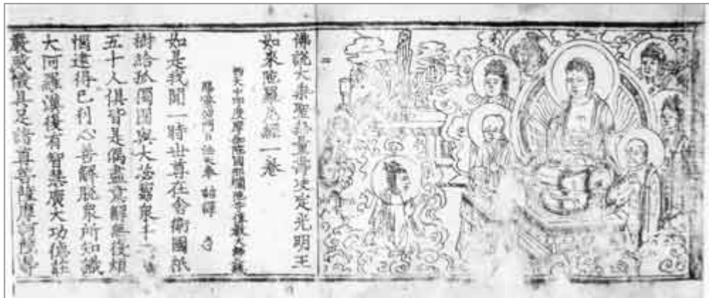
圖版五：漢文《佛說大乘聖無量壽決定光明王如來陀羅尼經》

西夏光定四年（一二一四），神宗遵項在內外交困、國力衰微之際，以皇帝的名義繕寫泥金字《金光明最勝王經》，用優質的紺色紙，書以精美的泥金西夏文字。看來，在西夏後期，佛教曾進一步傳播。至晚期受到戰亂的影響，有衰落的趨勢。