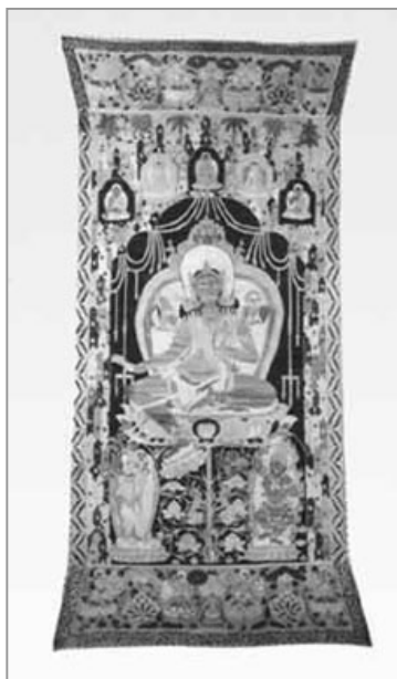
圖版十：黑水城出土西夏唐卡「綠度母圖」

花，串珠垂挂於寶座周圍，寶座在蓮莖承托的蓮花上，寶座上方有五如來，五如來上有六棵樹，綠度母右下方為黃色二臂摩利支，左下方為蘭色除障賜福女神圖像。唐卡上下兩端各加縫寬幅長條，內有空行母奏樂。線條優美，技藝精巧。「十一面觀音像」高一三二·五釐米，寬九十四釐米，觀音端坐在正中蓮花座上，十一種面孔分別表示出慈悲相、憤怒相，最頂上一面則為佛面。圖上部有五身坐佛像，左右和下方分格畫有八幅圖像作為中心觀音像的陪襯。[註 64] (圖版十)