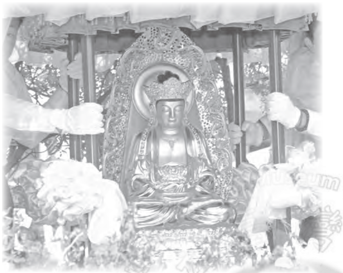
■ 靈鷲山無生道場毗盧觀音