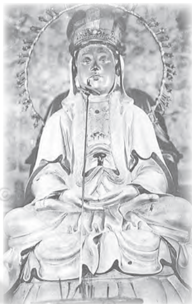
■ 新超峰寺毗盧觀音

（相當於後來所稱的省長）為蔣允焄。他有一天巡視大岡山，看到高僧紹光在山中築茅為庵，過著清修苦行的日子。為了幫助紹光，他使出飛瓦計，令民眾自動搬運磚與瓦，以完成超峰寺的創建工程。蔣知府又回普陀山請來一尊白衣觀音，供於佛龕正中。此尊像在日治時代晚年，被移位供奉於大岡山腳下的新超峰寺大殿內，至今未變。