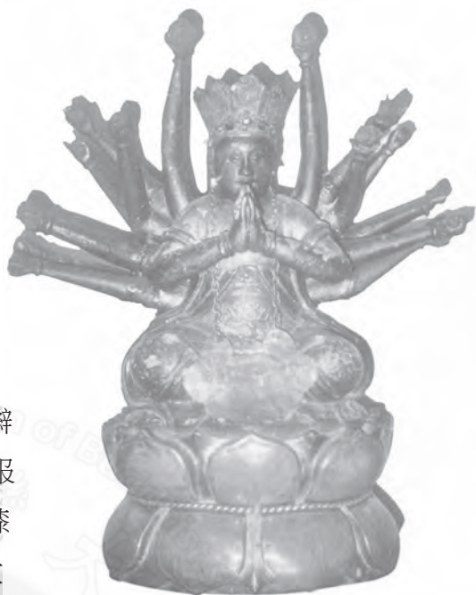
■ 台南白河大仙寺十八臂準提觀音像

此古銅觀音像頭梳高髮髻，髮尾結髮辮，辮飾成圈露出耳外，髮辮垂及前胸，髮頂戴五佛冠，冠型碩大外張，冠辮作突出三角形，辮內突刻毗盧佛。觀音身著漢式服，袍服長袖口寬鬆，覆蓋兩臂，並掩過兩腿膝蓋。胸前瓔珞花紋圖案，沿襲元代密教觀音的瓔珞紋飾。七寶古銅毗盧冠觀音像是顯密合流的式樣，彰顯了台灣顯密交融的修行法門。其中七寶古銅毗盧冠的冠形外張堂皇，花紋細緻華麗，全冠古銅漆黑，有古樸的韻味。無生道場的毗盧觀音像，金色亮眼，是二十一世紀精湛工藝技巧的表現，比較這一古一今、一舊一新，卻有一脈相承的軌跡可循。