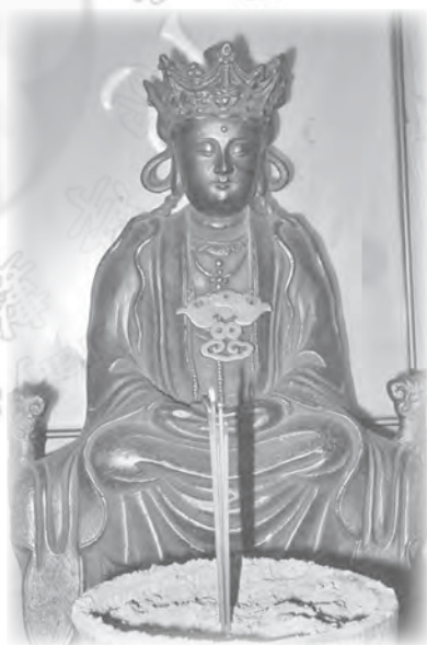
■ 鹿港七寶古銅觀音像

這尊全身潔白的觀音像（見插圖），頭梳高髮髻，髻上覆頭巾，巾帶連結前胸衣領，額頭頂上另戴銀色五佛冠。白衣觀音身著覆蓋兩肩的漢式袍服，雙手置腹前，兩腿結跏趺坐。就寶像神情，衣服式樣、手印坐姿等觀之，奉安於靈鷲山無生道場的毗盧觀音像，與此尊製作於二百六十年前的白衣觀音像，是十分相類似的。只是毗盧觀音頭戴毗盧冠，冠與頭一體成形。而大岡山白衣觀音像，其早期所戴毗盧冠與頭身，是不同材質所製，近年供像上的毗盧冠已摘除。