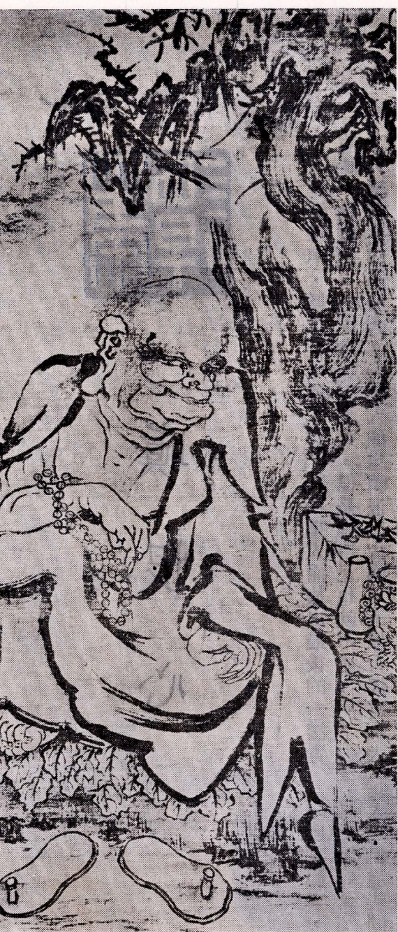
△ 羅漢圖 五代·貫休