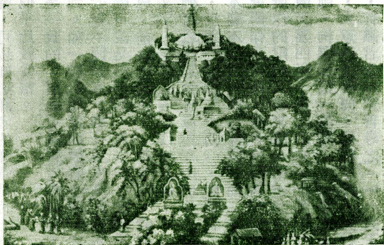
△尼泊爾佛著名聖地——垂蔭蕪坡全圖，是坡蔭垂。圖全坡蔭垂——地聖名著教佛爾泊尼。塔利舍佛是頂山，山小的麗美景風座一都滿德甲府首國。嚴莊為極，字廟喇嘛及，塔小多很有也，

攜回的佛舍利，建塔在現今的尼泊爾國最著名的佛教聖地——垂蔭蕪坡供奉，從此這地方就常出現舍利子，全是白色，滾圓形，一粒一粒，大的約綠豆那麼大，小的同芥子那麼小，也有中型的。這樣的舍利子，經當地喇嘛念咒加持，會變多，會長大，有人用以賣給信徒。信徒們請回來，拌點西藏紅花在裏頭，