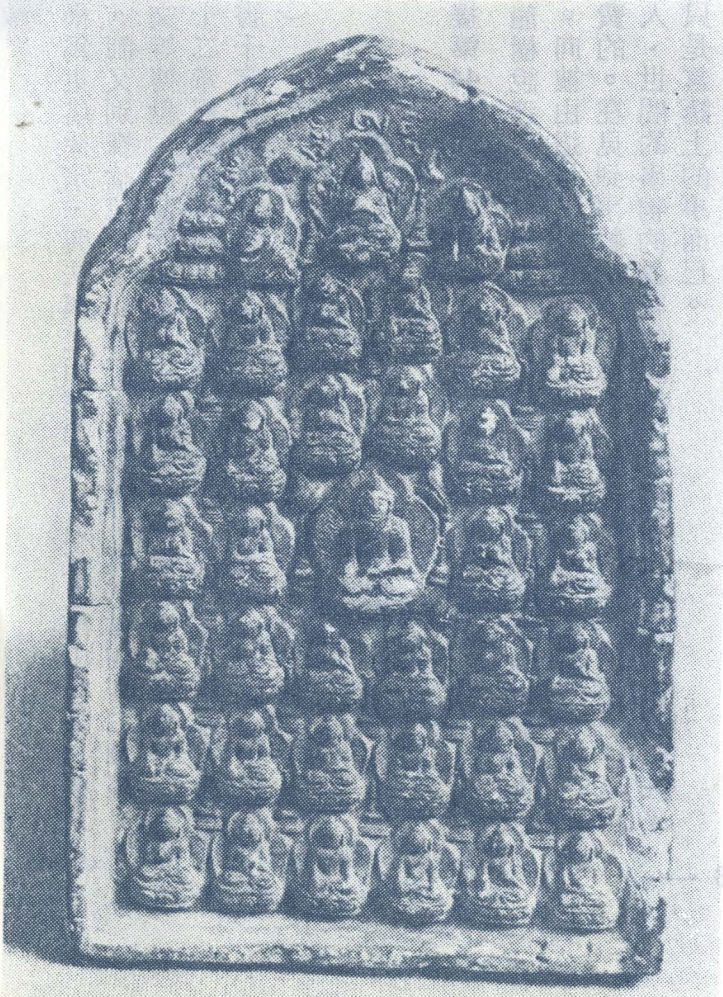
▷ 善業坭 密教造像