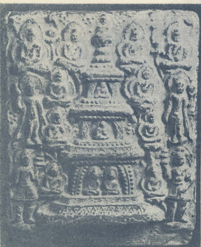
◁ 善業坭 多寶塔造像