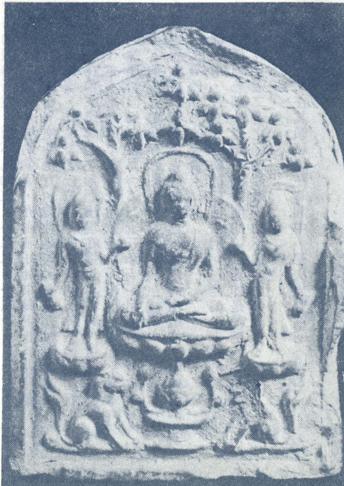
▽ 善業坭 釋迦像