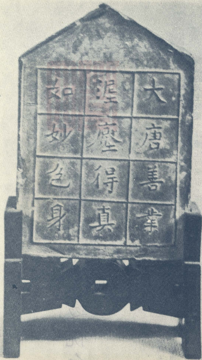
◁ 善業坭 釋迦佛像背文