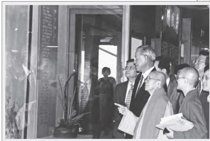
民國八十七年六月二十三日，當時總統李登輝先生（左二）參觀曉雲法師書畫展，曉雲法師陪同解釋（左三）

曉雲法師讀萬卷書、行萬里路，融通佛理與藝術，其獨特且生動的教學方式，也是讓學生回味無窮的記憶，法師透過對生命的體悟來轉述佛理，既是講學，也在說法。她講課時活力充沛，聲音宏亮得彷彿將整個生命投注其中，每當講到佛法中令人歡喜的事情，她會率直地哈哈大笑；若講到社會或人心的問題，音調即隨之轉為沉重，有時，法師只用簡單而瀟灑的一、兩個