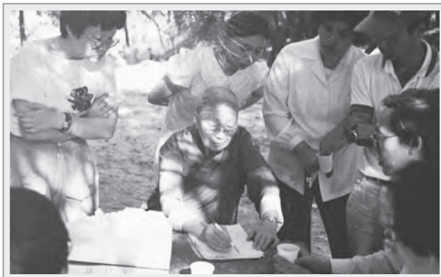
籌建華梵工學院時期，曉雲法師（中）親繪校園草圖供建築師參考

民國七十二年到七十三年，在華梵工學院的籌備過程中，資金比較顯著困難；當時，因為曉雲法師的辦學理念，受到永明寺住持信定法師的支持，所以永明寺的信眾居士，也隨之紛紛響應護持曉雲法師。在學生、弟子心目中的曉雲法師，是總以悲心、願力與「等視無差別」的般若智照，以及超乎尋常的毅力與行持，直下承擔面對問題，一關一關渡過困難險阻的大成就者。曉雲法師始終秉持「一以貫之」與「凡事豫則立」的行事風格，她對既定目標的「堅持」有目共睹；而她負責認真的態度，更非常人所能企及，她曾說：「這一生做不完，下一生我還要乘願再來！」足見她是以行動來驗證自己所立下的宏願，無論遭遇任何挫折、磨難，法師總是銘記恩師倭虛大師「向上一著」的遺訓，一心朝向既定目標昂首奮進。