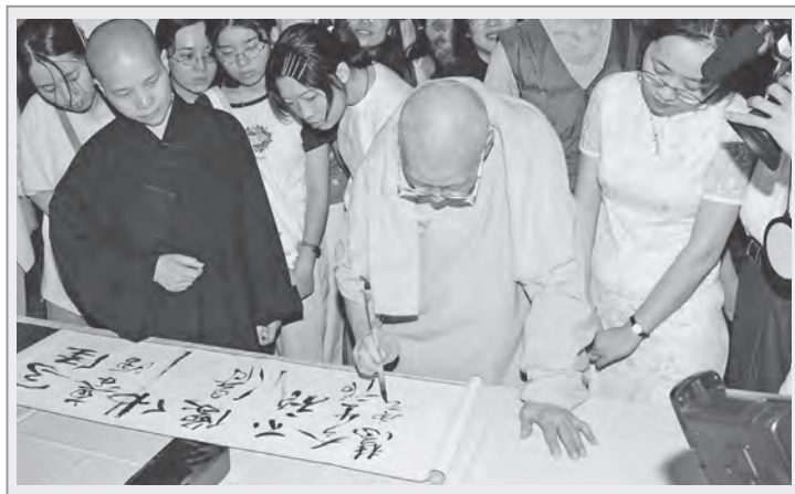
華梵大學美術系畢業美展上，曉雲法師在畢業生作品寫經手卷提字 (引用自華梵大學秘書室數位校史館)

說佛法、佛學怎麼好，我們必須了解現代的教育文化及其需求。」曉雲法師幾經考量，若興辦有正式文憑的社會大學，即使非佛教徒也能就讀，對於社會的影響層面將更廣、更深，故開始創辦大學之路，落實僧俗「二部並進」教育。