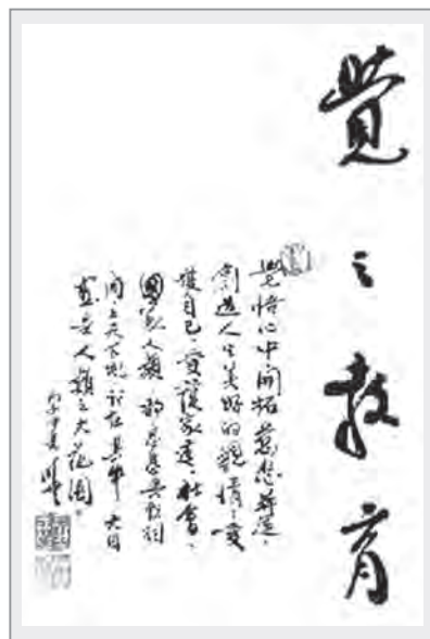
曉雲法師親題「覺之教育」

此外，曉雲法師也是國內最早提倡「園林思想」的教育家，在此科技掛帥，人類亟需回歸自然的時代，曉雲法師提倡「園林思想」的性情教化，藉著與大自然的親近反璞歸真，體悟天人合一的和諧圓融，及體現禪宗不拘形式的生活教化；由「園林思想」而延伸出的「境教設施」，在現今眾多佛教大學中，也是獨樹一幟的。法師將佛法、儒家文化融入環境教育設施，令學