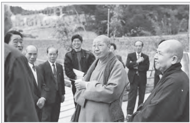
籌建華梵工學院時期，曉雲法師（中）對參訪之訪客談華梵校園規畫，右一為永明寺住持信定法師