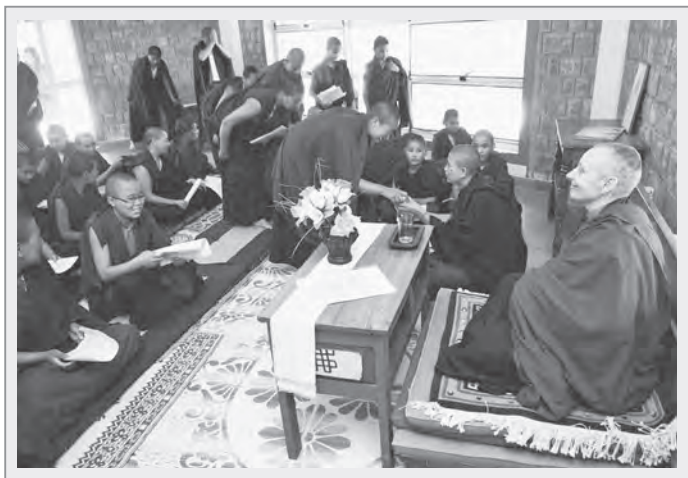
丹津葩默比丘尼（右）正在指導道久迦措林寺院的比丘尼

丹津葩默比丘尼成立比丘尼寺院的的目的之一，也在於透過口授傳承，恢復竹巴噶舉體系中獨特的女瑜伽士密法傳承，比丘尼寺院訓練尼眾經過基本教法和儀式、禪修訓練，從中選擇較合適的人選修習這項傳承。同時，丹津葩默比丘尼也籌設國際閉關中心，希望提供做為女尼及外國女性專心實修的場所，尼眾則可擔任指導老師。