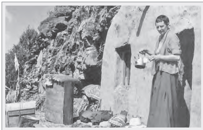
站在閉關洞穴外的丹津葩默比丘尼

丹津葩默比丘尼在二十七歲時，聽從上師的建議，前往位於西藏邊境的印度希馬查·帕地西（Himachal Pradesh）最北山區的拉乎爾。當地村落及寺院中不時舉辦的團體活動，使她很難專注閉關。最後，丹津葩默比