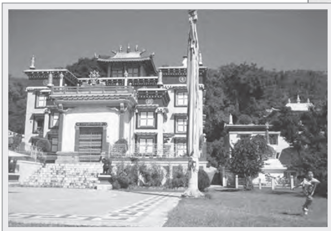
道久迦措林（Dongyu Gatsal Ling）比丘尼寺院

了在印度籌建道久迦措林（Dongyu Gatsal Ling）比丘尼寺院的計畫，目標就是提供比丘尼接受教育、修行及各種訓練的機會。丹津葩默比丘尼並環遊世