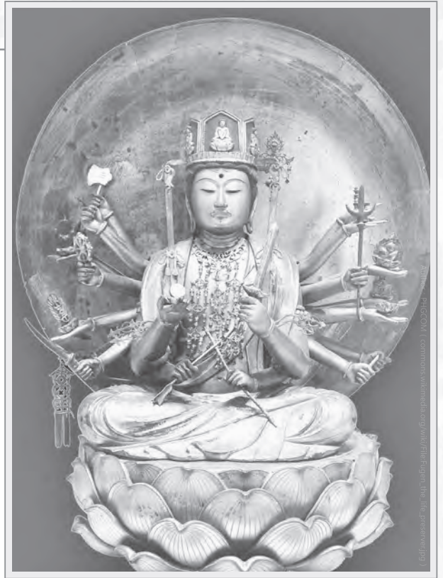
普賢菩薩像，現藏於巴黎吉美博物館