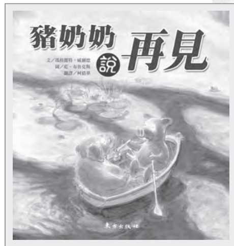
《豬奶奶說再見》書封