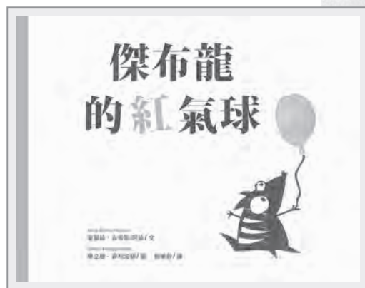
《傑布龍的紅氣球》書封