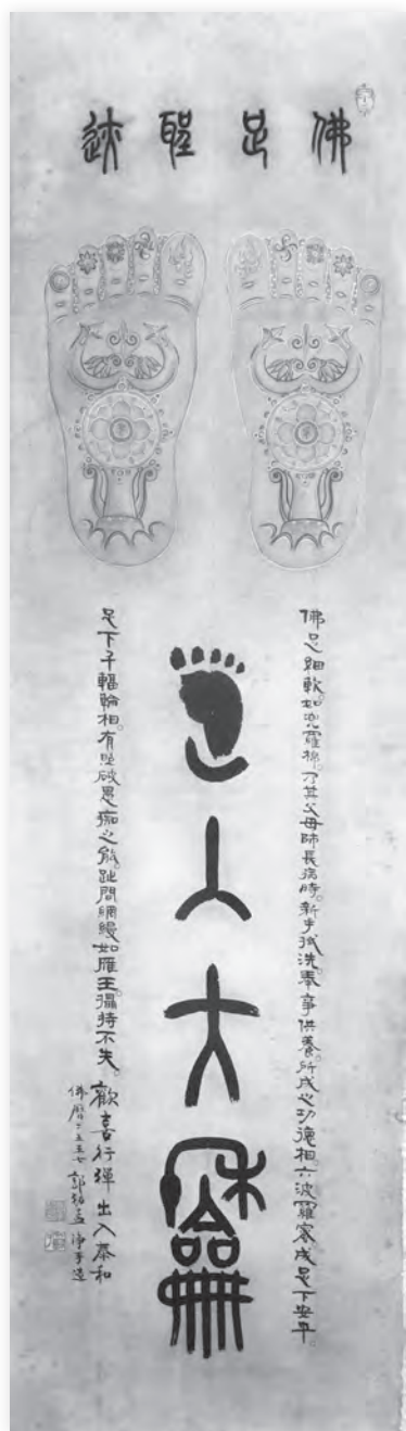
〈佛足聖跡·出入泰和〉

指導書法的郭祐孟，提供了五幅作品，有小篆、繆篆、鳥書、隸書、楷書等不同書體為表現主軸。首幅「佛足聖跡，出入泰和」，長條幅形，上端以篆體橫書「佛足聖跡」，並以線條勾勒出兩支佛足印，足印上繪三寶標、蓮花瓣法輪，與支撐的基座。下端直式書寫「出入大和」，融和圖畫書法的韻味，兩旁行楷細字，右行文曰：「佛足細軟，如兜羅棉，乃其父母師長病時，新手拭洗，奉事供養，所成之功德相，六波羅蜜，成足下安平。」