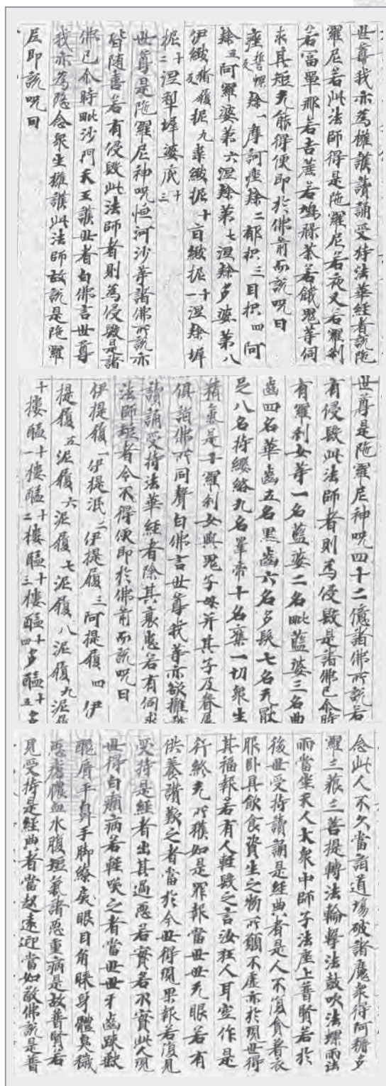
現存於東京大學的唐鈔本《妙法蓮華經》（局部）

鳩摩羅什大師翻譯的《妙法蓮華經》，後來成為中國佛教史上，隋唐時期第一個宗派——天台宗的立宗中心；《阿彌陀經》，成為後世淨土宗的立宗基礎。大師所翻譯的《維摩詰經》、《金剛經》等，流傳後世至今仍歷久不衰，受到廣大讀者的喜愛。◎