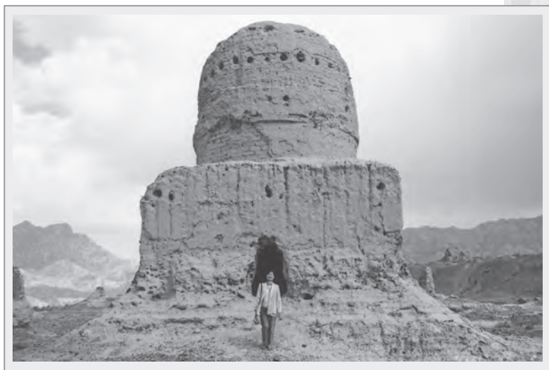
作者攝於蘇巴什佛寺遺址前

為了記念鳩摩羅什，克孜爾石窟的入口處，便造做了一尊鳩摩羅什像，圓頂光頭，領首下視，身披通肩式服，拱膝半跏坐姿，表現了龜茲高僧的神韻。