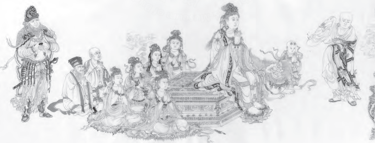
圖一 〈維摩詰演教圖〉

走進位於靠窗的展室，一眼被一幅〈降龍羅漢〉（圖四）所吸住，畫中以流暢的線條勾出一位光頭無髮、瞳目黝眉隆鼻張嘴的羅漢，昂首面對上端的巨龍，右手持珠，左手持瓶，坐在石上，右腿跨在左膝之上，膝旁袈裟袍服之下，躲著一位孩童，神情十分畏懼，應是彰顯了畫上角飛騰的惡龍，張牙舞爪，恐怖萬分。鳳琴捕捉到了傳統羅漢畫尤其是貫休畫的神