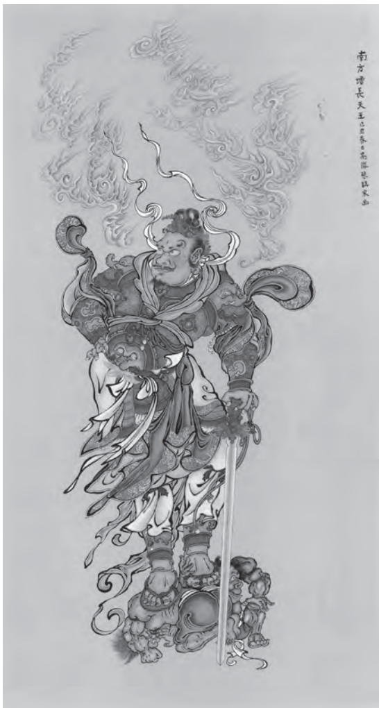
圖五 〈四大天王之南方增長天〉