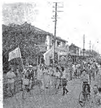
伍隊行遊的寺山靈與社蓮(上)