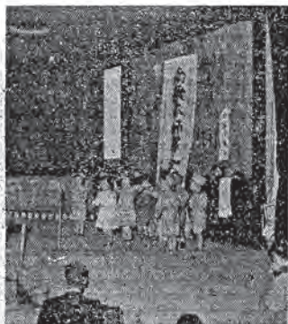
雄英小演表所兒托興復(上)