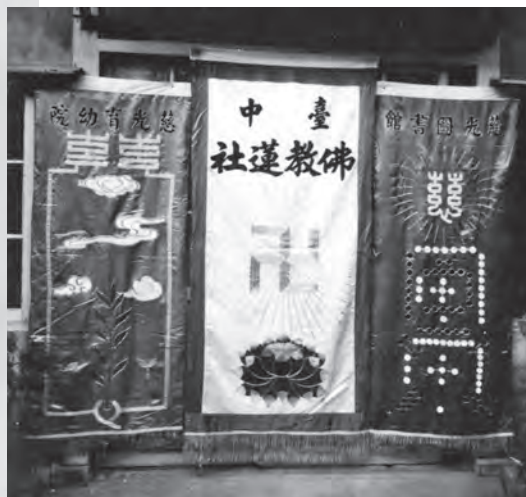
圖9：佛誕節遊行旗幟1