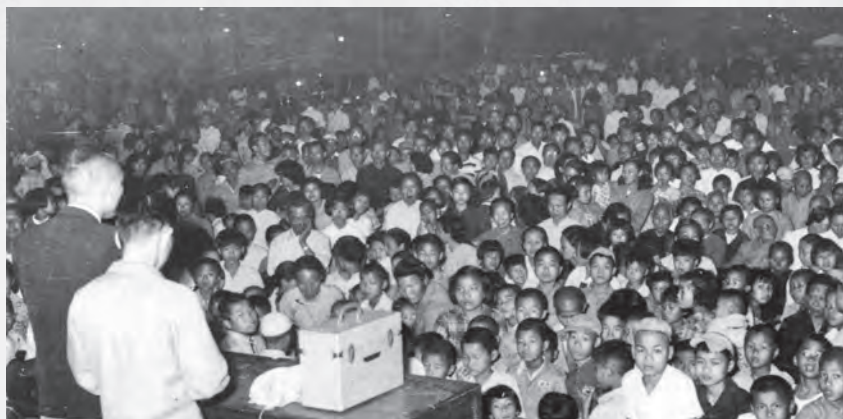
圖19：電影或幻燈晚會