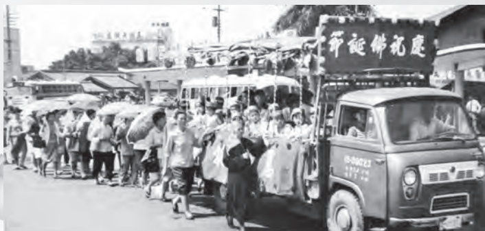
圖22：慈明寺信眾與慈明幼稚園園生隊伍