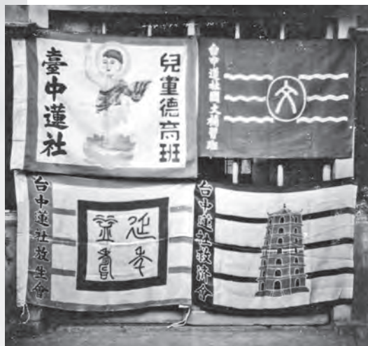
圖10：佛誕節遊行旗幟2