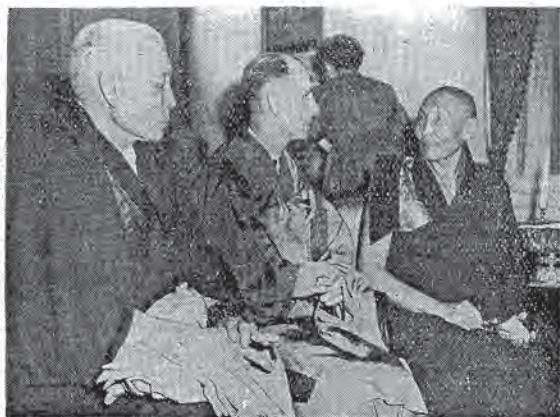
喇傑多(左)師法頓夫立克(中)佛活瓦魯迪(右) 影合中會誕佛祝慶在嘛