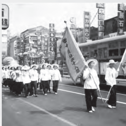
圖16：臺中蓮社慶祝佛誕節