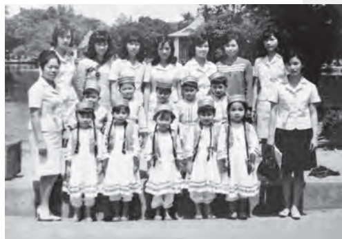
圖23 慈明幼稚園慶祝佛誕節新疆舞遊藝表演