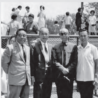
圖17：佛誕節於公園集合