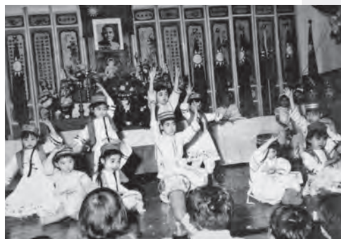
圖24 慶祝佛誕節新疆舞遊藝節目