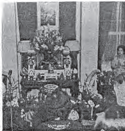
壇佛嚴莊的飾裝所卉花的麗鮮澤色 (人夫辛拉薩使大泰爲角右)