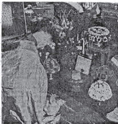
佛在師法頓夫立克席主會教佛方西 拜禮前