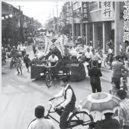
圖14：佛誕節三輪童車