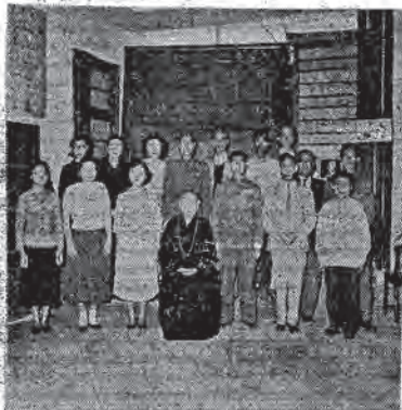
影攝體全班法弘年青社蓮(上)