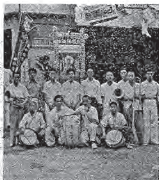
班樂天年青的社蓮(上)