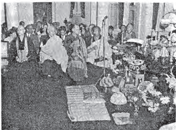
華 盛 頓