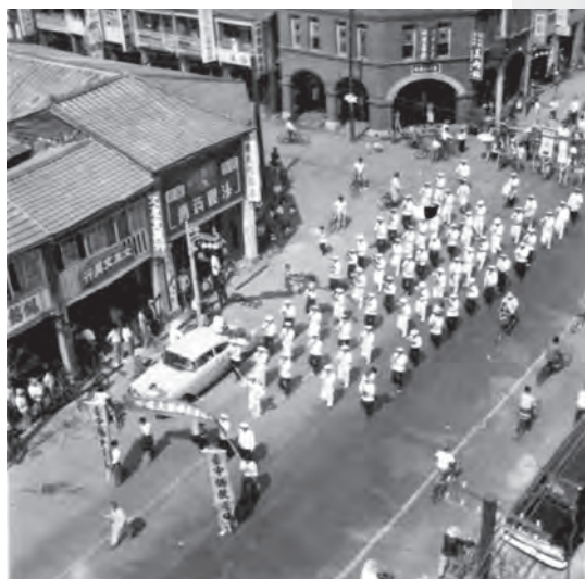
圖8：臺中市佛教蓮社聯體機構佛誕節鳥瞰