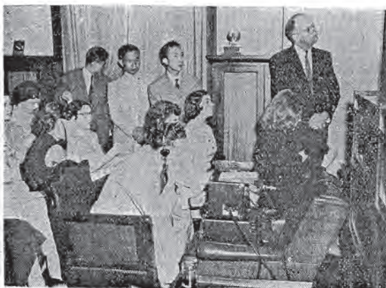
國美·行舉社友之教佛頓華：音錄節誕佛 送播音之

卍 卍 節 誕 佛 國 美 在 (頁七第期本見詳文專) WASHINGTON "FRIENDS OF BUDDHISM" CELEBRATE WESAK 卍 卍