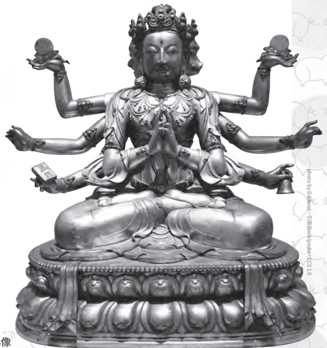
摩利支天示現菩薩相，18世紀銅鑲金佛像

特別的是，摩利支天菩薩圓滿具足「息增懷誅」四事業，不論於世間法或不共解脫道出世間法，都是殊勝、加持迅速不可思議的成就法門。四事業之功德略述：