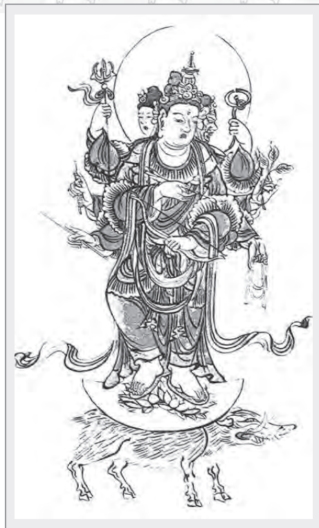
日本供奉的摩利支天形象

「誅業」——於外違緣如官司纏訟、小人不斷、各種傳染病與疫疾、邪咒蠱惑、非人、天龍八部、魑魍鬼魅等害之迴遮；內違緣為我執、五毒煩惱困擾之身心諸疾之預防及調癒等。