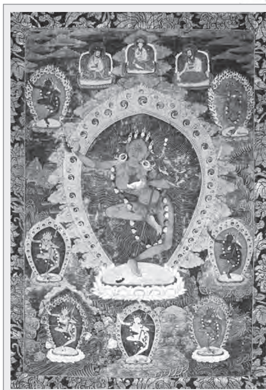
18世紀金剛亥母唐卡

相傳金剛亥母原本是西藏古老苯教中的神靈，平常遊走於天空也居住在天空，直到蓮花生大士入藏弘法時被降伏，成為密教中的本尊護法。藏傳佛教許多大成就者如：帝洛巴、那洛巴、馬爾巴、密勒日巴、岡波巴、歷代大寶法王，都曾修習金剛亥母觀修法。而在藏傳佛教噶舉傳承修法中，三個最主要的本尊為勝樂金剛、金剛亥母和紅觀音，其中之一就是金剛亥母。第十世大寶法王精通工巧明，也曾親手塑造金剛亥母像。