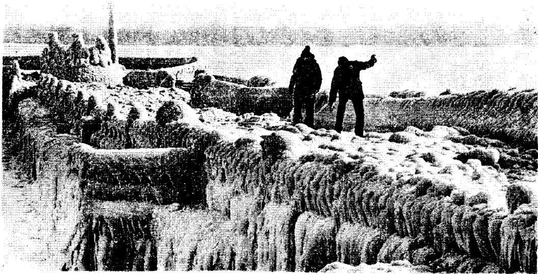
破六十年來奇寒紀錄，三月份大雪冰封加拿大東岸大西洋之濱。

我們善於處理，可以用心識之「能」驅役物質之「能」。反之，我們假若只知酒色財氣，貪、瞋、癡……等等，就變成「無明」，我們的本來的心識之能，就會被禁錮或污染了，不能自由了，佛教講究追求內明等「五明」與五智，尤以內明為重要，就是從獲得內明來引向心識的明澄不亂，像「光束」射線一般，自由來去，發揮潛力，脫出生死。