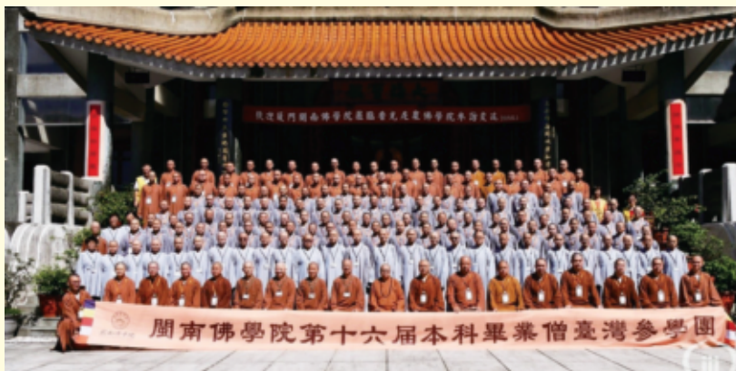
廈門閩南佛學院師生與香光尼眾佛學院師生全體合影。