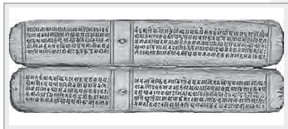
十一世紀尼泊爾貝葉經

大約到佛滅後100年後，阿育王出世時，才慢慢盛行將經典書寫成文字。最初是將經文書寫在貝葉——貝多羅樹的葉子上。據考證，這種做法最早始於公元前一世紀左右。最初佛法僅在恆河流域流傳，在阿育王統一印度後，依靠皇室的支持與力量，散播到印度各處。根據學者考證，阿育王曾派遣傳教師踏足於希臘、緬甸、越南、西域與斯里蘭卡等處，從這時開始，佛法以文字方式抄寫流傳，也因為貝葉經的盛傳流行，各地興起譯經風潮，爭相翻譯佛經。