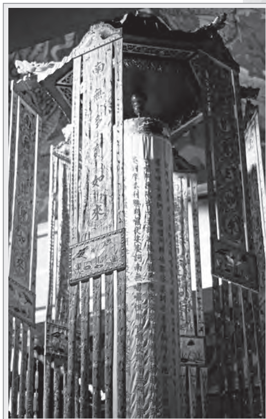
香港寶蓮禪寺大雄寶殿內寶幢

香爐 主要作用為焚香，又叫做「薰爐」。香爐是三具足——香爐、花瓶和燭台，亦即佛桌上經常需要放置的法器之一。有金、銀、銅、鐵、玉、瓷、琉璃等各種材質。形狀也有多種，大體分為方形和圓形，有三足、四足或無足之別。有些香爐上還鐫刻有圖案、經文等。分為四類：置於桌上的「置香爐」；持於手上的「柄香爐」；