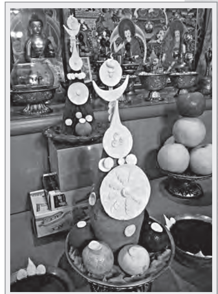
藏傳佛教特有的食子

食子 是藏傳佛教特有的，又稱作「朵瑪」。朵是摧毀貪著的我執，瑪是母親之意，亦即積累功德之母。過去由於西藏取得物品、水果不易，主食是糌粍（以青稞粉製作而成），於是發展出以糌粍加上奶油、糖，做成各式各樣形狀的食子供佛。可分為供養食子、本尊食子、成就食子、除障食子等。食子本身主要的意義在累積功德，一方面可供養，一方面可作布施。☉