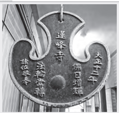
高雄蓮峰寺內懸掛的雲板

板 是報時法器，有木頭、銅、鐵等材質。板有許多類別：方丈板、首座板、坐禪板、齋板、巡火板、巡廊板等。禪堂內外處處懸掛大、小板，隨時依事，或擊一下、兩下、三下，飲食起居，行道辦事，用以報眾。