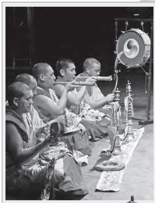
藏傳佛教法會中僧眾使用多種法器修法

鈴的造型像喇叭口，外部刻有圖案、裝飾花紋，柄杵呈現金剛杵形狀，鈴中則有鈴舌。鈴的上部代表佛身，下部代表佛語，其中則代表佛意。搖動時，鈴口朝下，音色清麗，