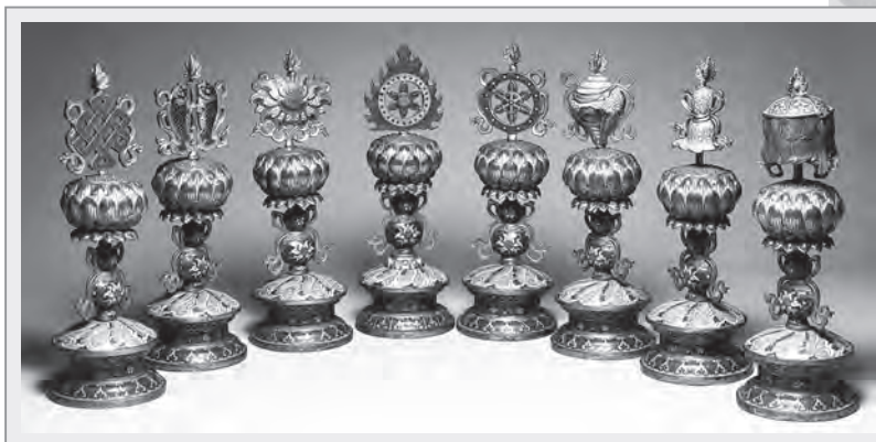
典藏於國立故宮博物院的清代掐絲琺瑯八吉祥供具

8.寶蓋 又稱「華蓋」、「傘蓋」，是古印度貴族和皇室出巡時的儀仗器具，為權勢、地位象徵。在佛法上代表佛頂，象徵佛法張弛自如，保護眾生，使眾生遠離魔障，離苦得樂。☉