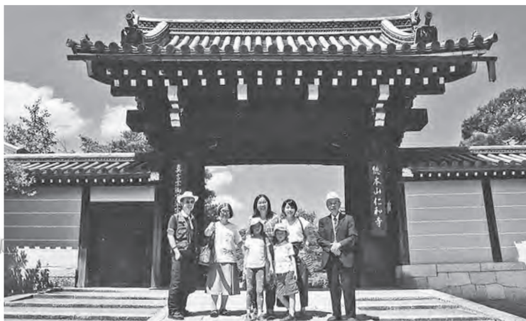
圖2 筆者(左二)偕同家人在本坊表門前留影