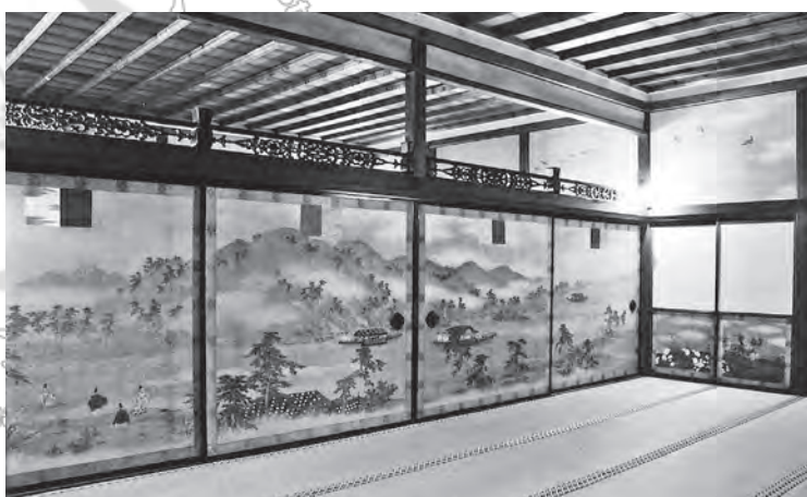
圖3 宸殿內的隔扇門畫