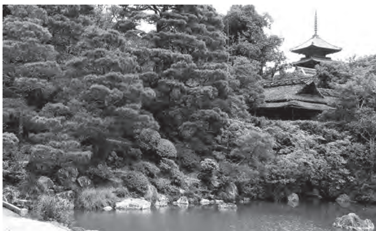
圖4 宸殿外的庭園景致