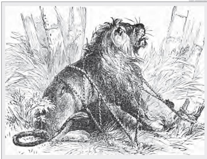
1882年於美國紐約出版《伊索寓言》中的獅子和老鼠故事插圖

雖然這是一篇寓言故事，好像只是在人類的幻想虛構世界裡才會發生，但在的歷史記載中，也曾有許多關於畜生救人與報恩的故事。今年適逢鼠年，且藉今年之生肖——「鼠」，來說說幾個具有靈性的老鼠救人與老鼠報恩的故事吧！