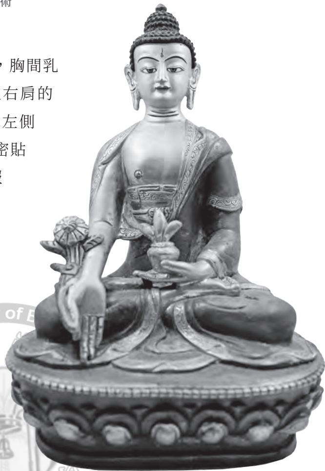
圖3 大圓鏡藝術所收藏之藥師佛像

佛像雙足作跏趺坐姿，身軀四肢細瘦，胸間乳點略為凸出。就佛衣而言，身穿偏袒右肩的服式，右臂、右肩、右胸全然裸露，左側所披袍服，自上身及於下身，均是緊密貼身的，此是承襲了印度、南亞的僧服系統，但袍服領口衣端前後均以線刻凹雕捲草紋鑲邊，極其細緻。蓮花寶座，平面呈三角橢圓形，前寬後窄，不作正圓形，較接近盤坐時的底座平面觀。蓮花座的上下立面是以線刻浮雕仰蓮瓣、俯蓮瓣，上加連珠紋圈成的花托，下安置基座等裝飾而成。此尊佛左手持藥鉢，右手持訶梨勒果（藥草名），表現出濃濃的藏傳佛像風格，曾被鑑定為17世紀前後的作品。