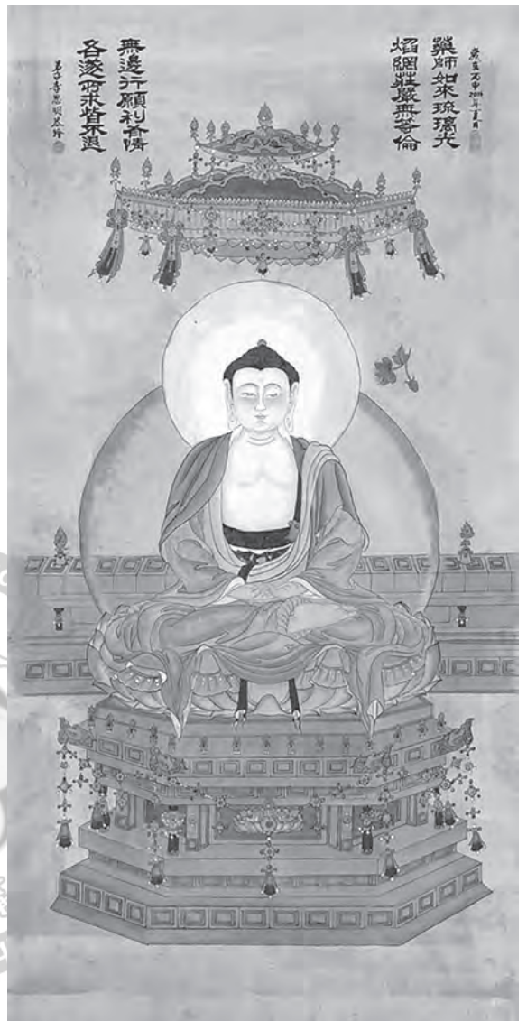
圖5 李思明所繪藥師佛像

總之，藥師佛的造像，以戒、定、慧三無漏學構成了其實相、坐姿，以手中印相與持物彰顯了藥師佛救渡眾生病苦的願力。◎