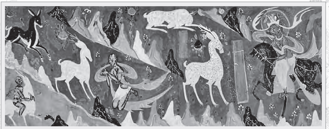
敦煌石窟內的九色鹿本生故事壁畫