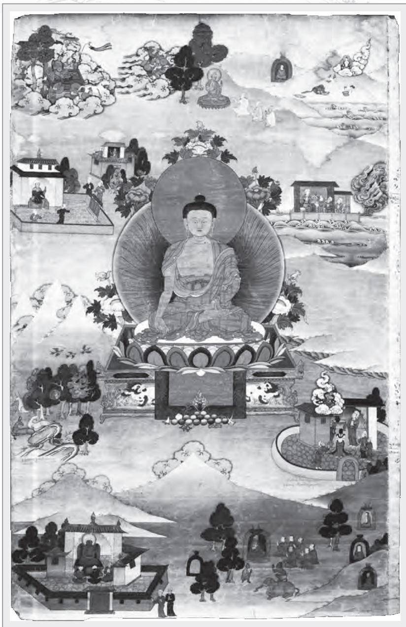
描繪佛本生故事的19世紀唐卡，收藏於美國魯賓藝術博物館

註一：參考自學者鄭殿臣於《中國佛教文化研究所·佛學研究》第1期所發表之〈《南傳大藏經·佛本生》初探〉。