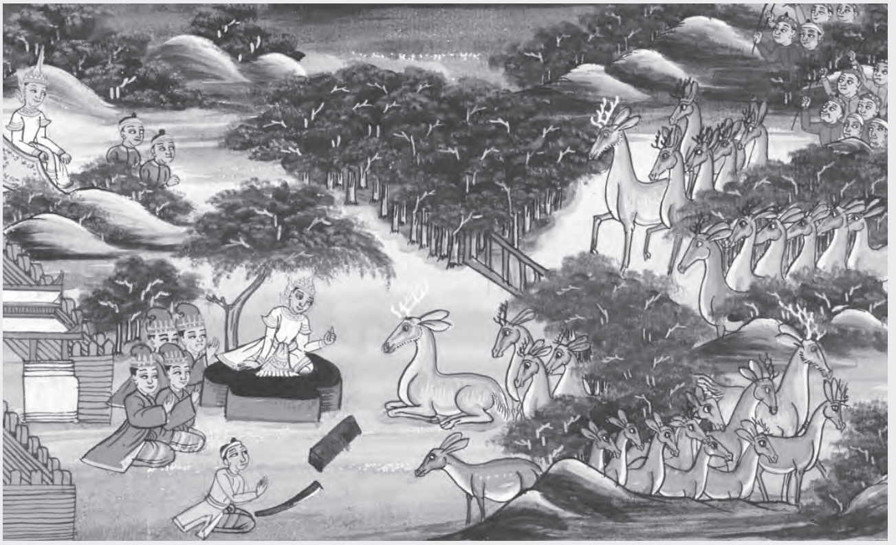
收藏於大英博物館的緬甸19世紀本生故事圖（局部）

Mingdunmaga Jaraha, British Library, Ms. Burnese 202, f.12r. © CC BY-SA 3.0