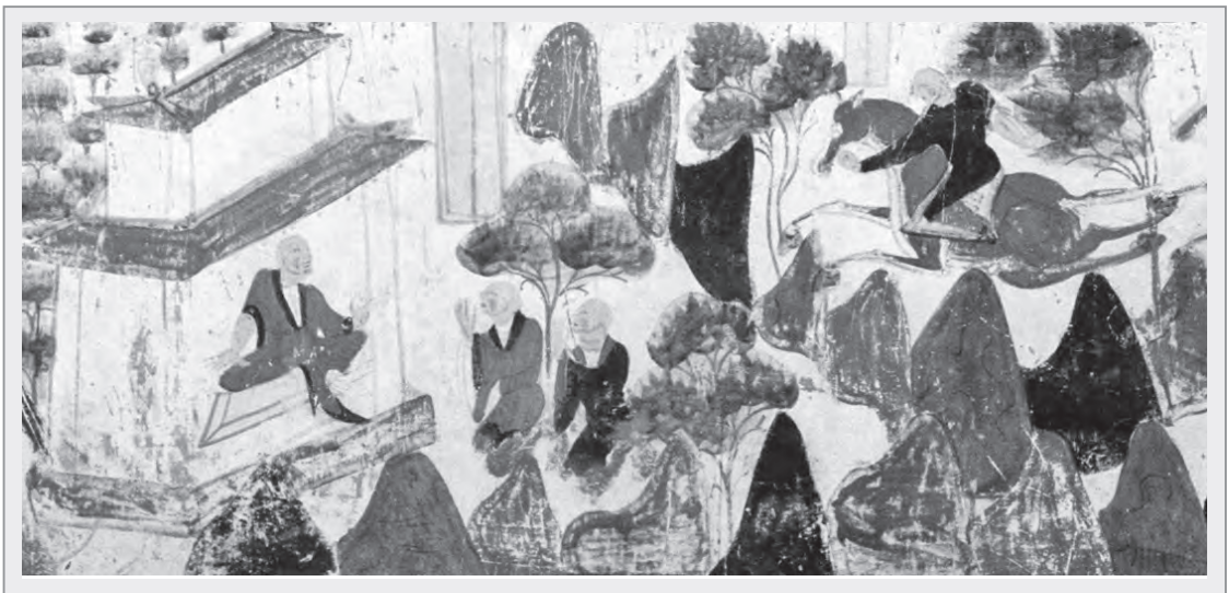
大王子和二王子向國王跟夫人稟告三王子捨身救虎

這天午後，國王的夫人獨自在王宮午休，突然夢見自己的雙乳被割下，牙齒也跟著脫落；接著又夢見手上握著三隻鴿子的雛鳥，其中最小的雛鳥，竟被不知從哪飛來的老鷹給叼走。夫人驚醒後，發現自己的雙乳竟流出了乳汁。這時，平時伺候著夫人的侍女氣喘吁吁地跑進門來，邊跑邊喊道：「夫人！夫人！聽外面的侍衛說，王子們失蹤了。」夫人一聽，不祥的預感湧上了心頭，淚流滿面地向國王說道：「大王啊！我們痛失了最小、最疼愛的那個三王子啊！」國王聽夫人這麼一說，心裡一驚，語帶哽咽地說道：「天啊！我竟要失去了我的愛子嗎？」儘管國王難過至極，但他還是故作堅強地安慰夫人說：「夫人妳先不要這麼憂愁，我現在立刻召集城裡的所有侍衛出城去尋找王子，大夥兒齊心協力，一定可以找到王子