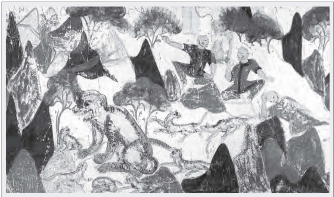
三王子發現母老虎與虎崽子

走著走著，突然看見樹林裡躺著一隻奄奄一息的母老虎，旁邊依偎著七隻剛出生不久，正吸吮母奶的虎崽子。大王子看見這一幕，憂心忡忡地說：「你們看！那隻老虎媽媽生完虎崽子後早已筋疲力盡，然而七隻虎崽子正處於最需要母乳餵養的時候，所以老虎媽媽捨不得抽身離開獨自去覓食，照這樣下去，老虎媽媽最後肯定會被飢餓給逼昏了頭，把自己的虎崽子們一隻隻吃掉的！光想到這兒，我心裡就萬分的不忍啊！」