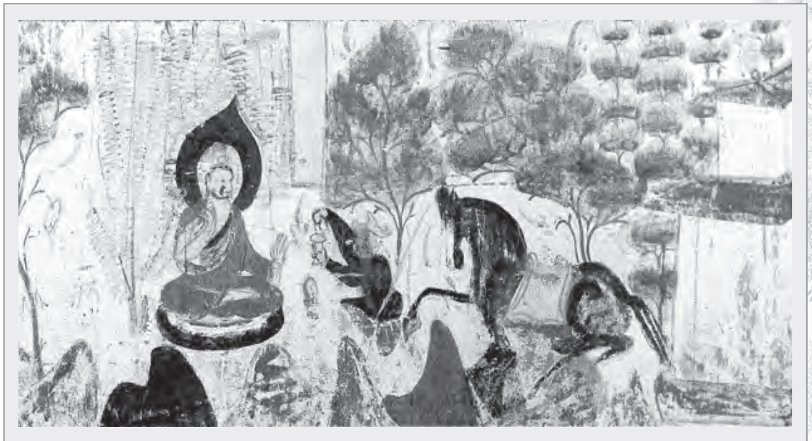
敦煌莫高窟428號內的本生故事壁畫，描繪佛陀指示阿難打開寶匣

佛陀觀察圍繞在身旁的比丘弟子們，認為因緣已然成熟，便以手輕觸地面。原本平靜的大地頓時震動了起來，一座莊嚴的七寶妙塔，竟從地底湧現而出。