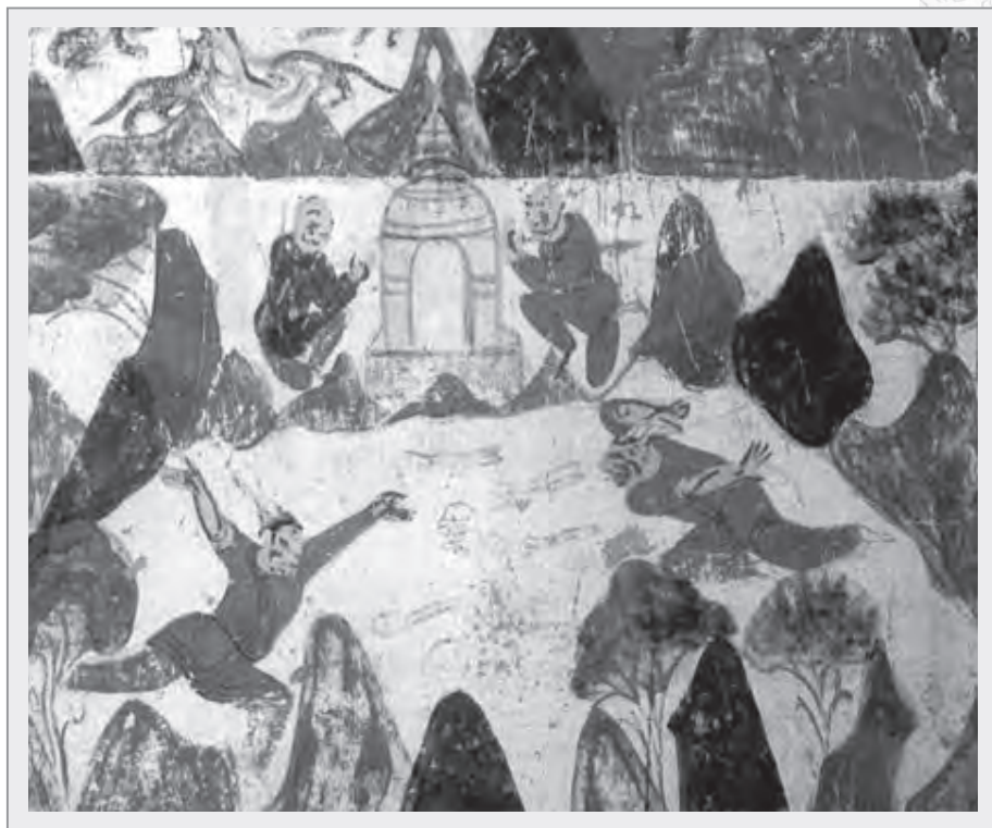
國王於三王子捨身處建塔供奉其身骨舍利

夫人頂著蓬鬆的頭髮，聲嘶力竭地痛哭著，國王見夫人情緒一時無法恢復，便與二位王子共同將三王子遺留的身骨收拾整理後，建造了一座莊嚴的七寶妙塔，將菩薩的身骨安置在塔中。