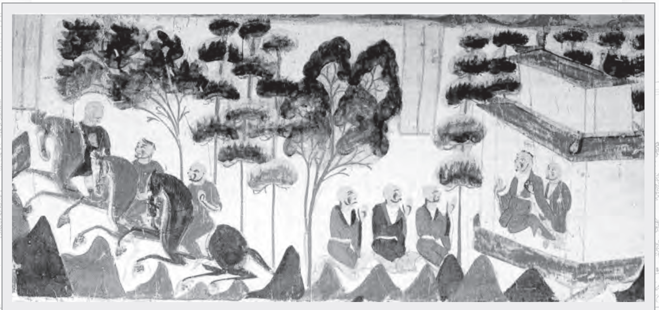
國王與夫人攜三王子出遊

佛陀說起，在過去的某一世裡，當時有一個國王名為大車，大車國王有三位王子，分別命名為摩訶波羅、摩訶提婆以及摩訶薩埵。國王喜歡偶