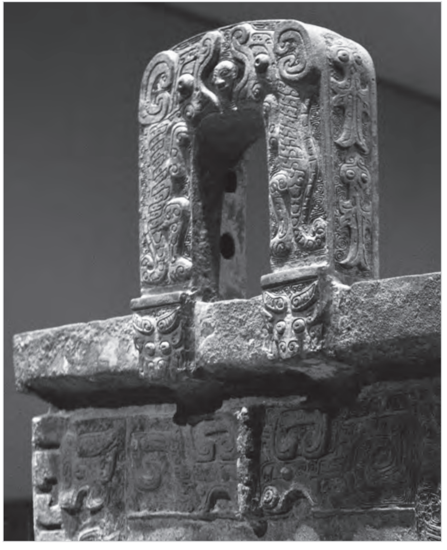
圖4 后母戊鼎的鼎耳與鼎身連接處有一對水牛（中國國家博物館）

從牛角形態判斷，商代青銅、玉器上的牛紋主要是水牛。八倍於牛方鼎重量的后母戊鼎，是迄今世界出土的最大青銅器。在鼎耳與鼎身的連接處，也有一對可愛的水牛。(圖4)