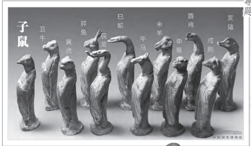
圖1 唐代十二生肖陶俑 (中國國家博物館館藏)

首先來到臺北中研院歷史語言研究所的歷史文物陳列館，那裡的商代牛方鼎出土於河南安陽。鼎的四壁與四足都裝飾了大面積的浮雕牛頭，腹底鑄一象形的