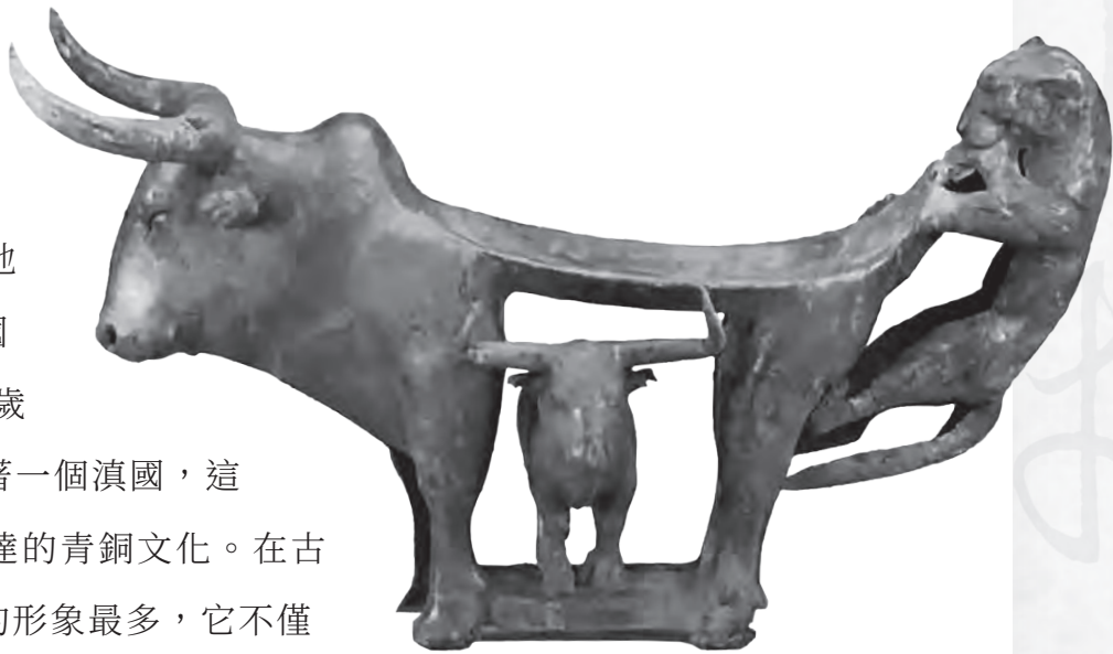
圖8 戰國牛虎銅案

這件青銅器叫牛虎銅案(圖8)，是滇國上層貴族祭祀時擺放精美食物的案桌。一隻猛虎用力撕咬母牛的尾部，雖然母牛的體型龐大，還有一對巨大的牛角，卻絲毫沒有掙扎，彷彿若無其事。牛的下腹部中空，藏有一隻小牛。牛與虎正在嬉戲？抑或是一場在沉默中勝負已分的生死較量？個體生命與下一代生命的取捨，死亡與新生，在質樸而狂野的線條中，古滇人究竟想向神靈訴說什麼呢？