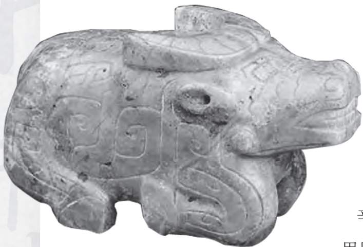
圖5 婦好墓出土之跪臥石牛

比如這件跪臥的石牛(圖5)，銘文為「司辛」，「辛」是婦好死後的廟號，可能是武丁用以紀念婦好的。