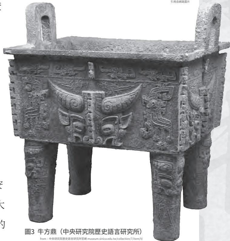
圖3 牛方鼎 (中央研究院歷史語言研究所)