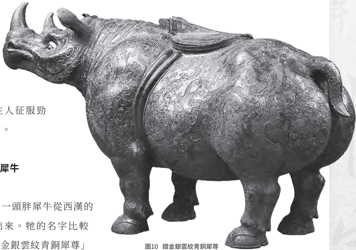
圖10 錯金銀雲紋青銅犀尊