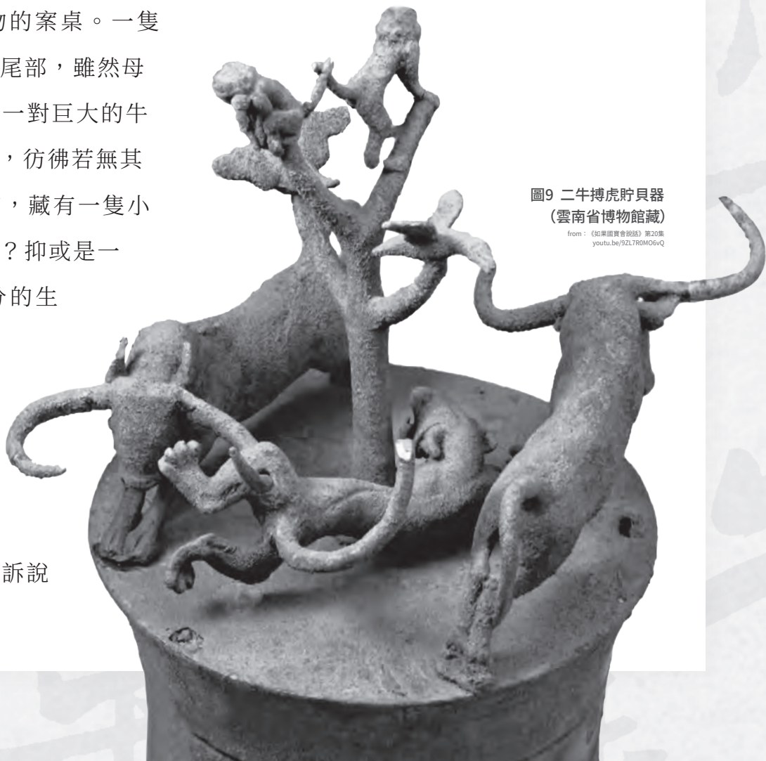
圖9 二牛搏虎貯貝器 (雲南省博物館藏)