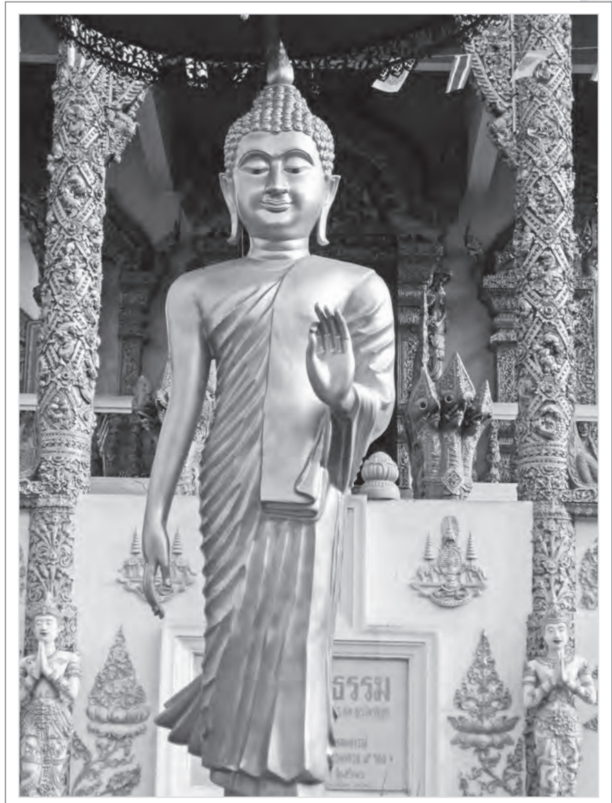
泰國清邁布帕蘭寺的佛陀行走像