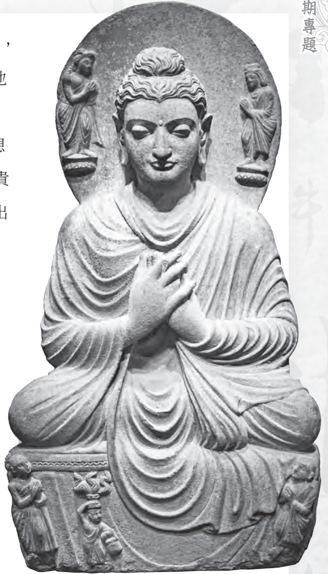
2-3世紀犍陀羅地區的佛陀石雕像