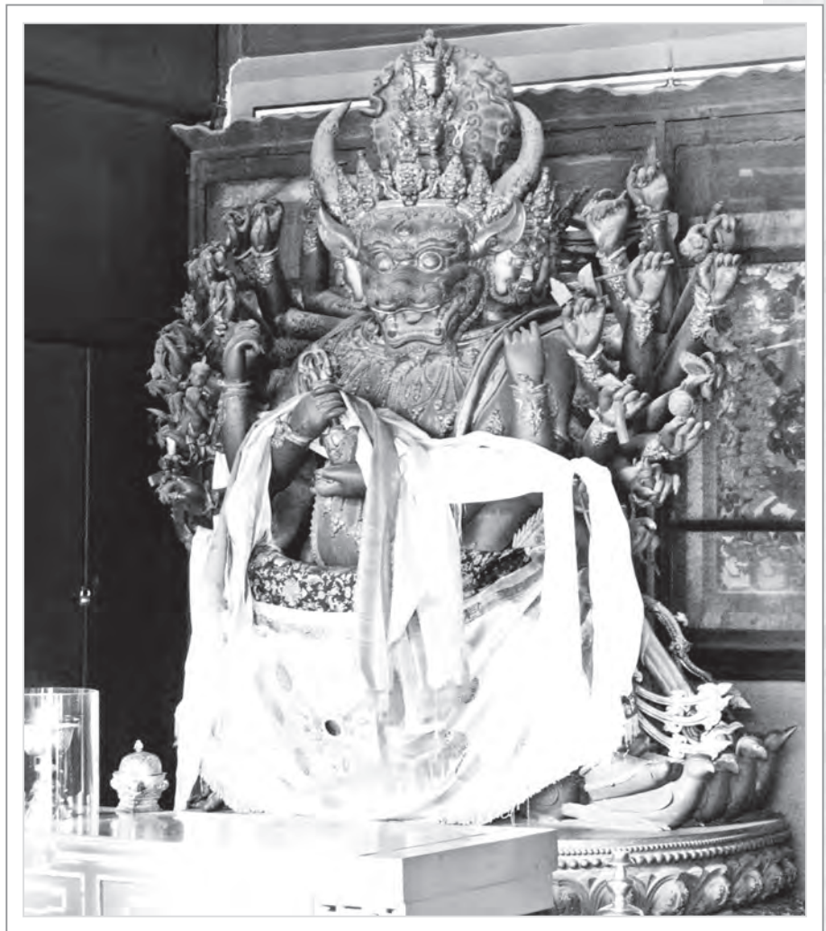
北京雍和宮內所供奉的大威德金剛像

相傳，大自在天有個兒子叫六面童子，某次為了爭奪領地，而與阿修羅王魯札在南瞻部洲開戰。結果六面童子慘敗，阿修羅王魯札大獲全勝。大自在天得知自己的兒子打輸人家，相當沒面子，因而召集了欲界三十三天與龍族的精銳部隊和八病、八魔等軍團，出征阿修羅王。經過幾日的激烈討伐，阿修羅王終究敵不過大自在天的龐然大軍，潰敗而逃。阿修羅王魯札戰敗後，為尋求依怙而皈依了聖者文殊。文殊菩薩為了幫助阿修羅王，而化身為大威德金剛。大威德金剛具有九個頭顱，居中頭顱為水牛的忿怒形象，用以威嚇龍族的精銳部隊；具有三十四臂，各持不同兵器與法器，用以降伏三十三天的軍團；化現十六足，踩踏著八病、八魔軍團的將領，並以此威猛形象宣說《大威德金剛密續十萬頌》，降服了傲慢的大自在天。