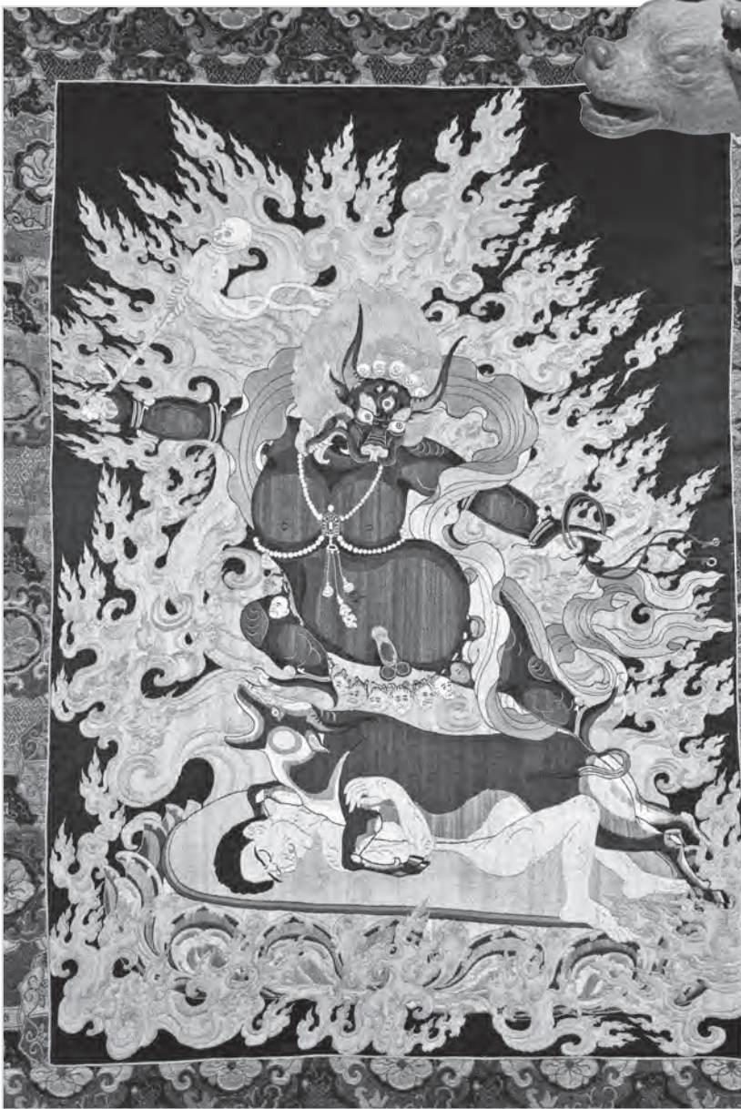
大英博物館所收藏的大威德金剛刺繡唐卡

閻羅護法又分有外閻羅護法、內閻羅護法、密閻羅護法等三種不同形象。其中外閻羅護法與密閻羅護法，都是呈現為忿怒的水牛形像，其雙足下的坐騎也正是水牛。☯