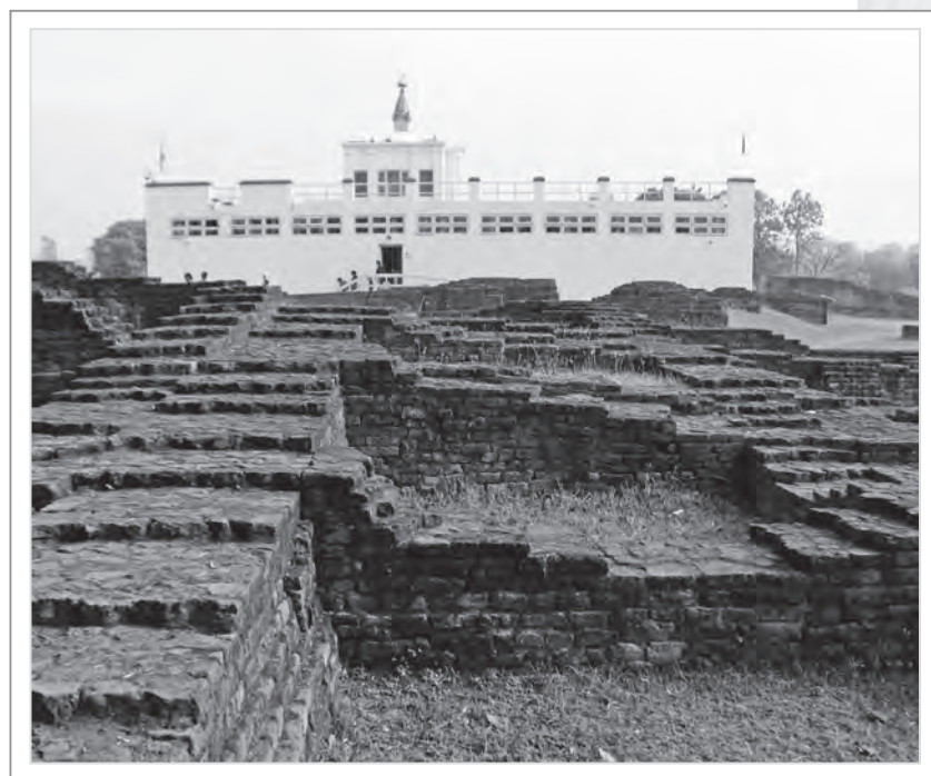
摩耶夫人寺與藍毗尼遺跡

1968年尼泊爾政府對藍毗尼進行復原工程，1997年，藍毗尼的遺跡更被聯合國教育、科學及文化組織列為世界文化遺產。