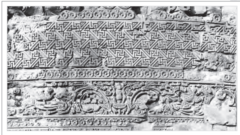
達美克塔石壁的精緻雕刻