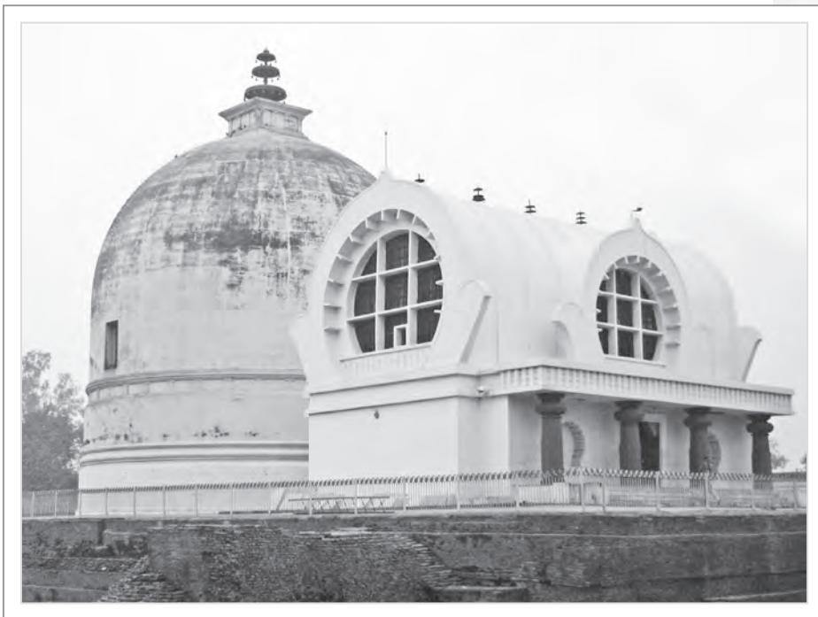
大涅槃寺與重建的覆鉢式佛塔

註：參考自佛光山佛陀紀念館2018年與英國杜倫大學、東方文化博物館聯合舉辦的「與佛同行——發現佛陀的故鄉」展覽報導，網址： http://www.fgsbmc.org.tw/exhibition/index.aspx?EID=2019003&MID=5