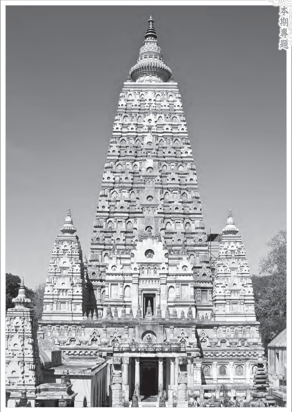
金剛寶座式的正覺大塔

據玄奘大師的《大唐西域記》卷八記載，最初阿育王在金剛座建造了一座小精舍，後來經過婆羅門擴建，