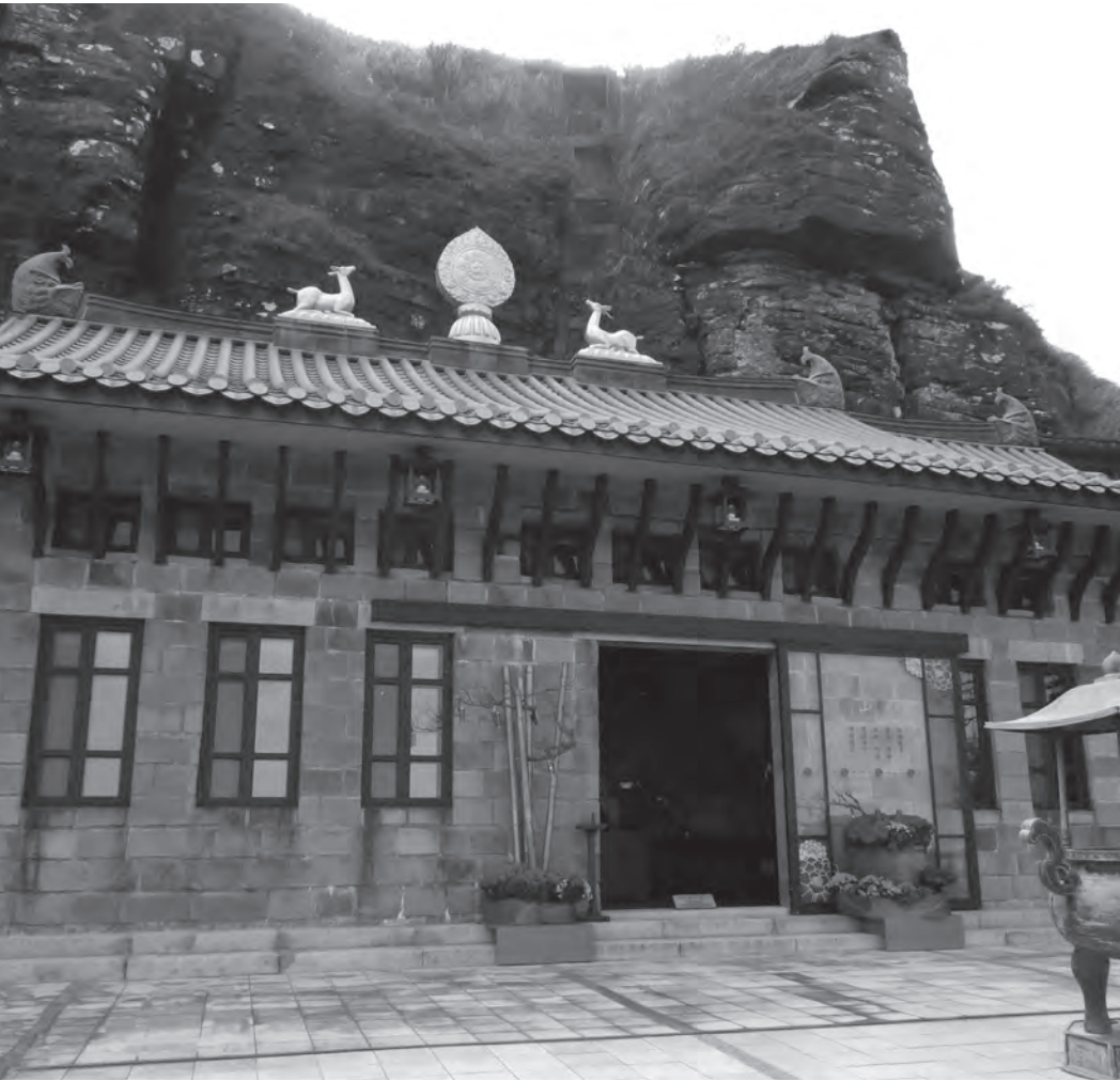
開山聖殿背倚麒麟岩，坐山面海

度逐次內縮，直至第九層，方見塔頂平臺，平台上蓮花瓣圍繞的圓輪，上加覆鉢體，再上為相輪、塔剎。