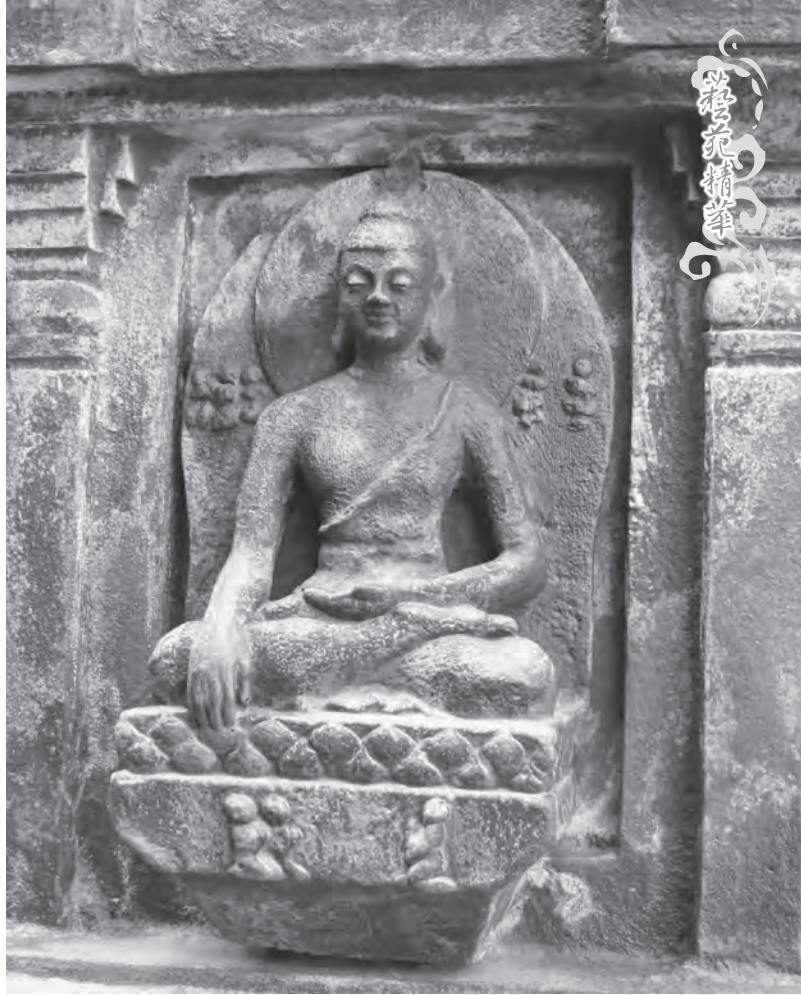
千佛塔上的石雕佛像

總結靈鷲山無生道場的建築風格，或呈現漢式禪風，或展示藏式系統造型。而就佛塔而言，圍繞著觀音菩薩四周的群塔，反映了早期在印度中亞以及西藏的佛塔架構。至於正覺千佛塔，則回歸緬甸王於12—13世紀之際所建造的佛塔式樣，推測應屬於南傳佛教系統。今日台灣南北各地道場所見，實無出其右者！🕒