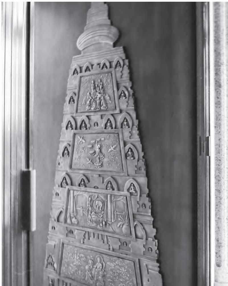
金佛殿門扉上的佛塔浮雕