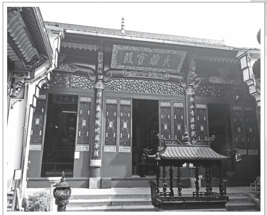
九華山化城寺大雄寶殿

善好施的佛弟子，讓地藏盡取所需。地藏說：「一袈裟足矣」，將袈裟往空中一拋，竟然將九華山的大小山頭全蓋住了。開心的閔公馬上讓自己兒子跟著地藏出家，法名道明，後來自己也追隨出家。因此，今天九華山地藏聖像的左右脅侍皆為閔讓父子。