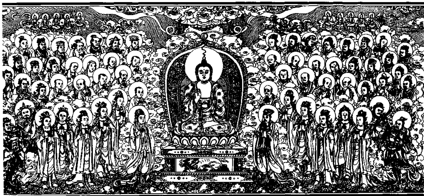
清刻龍藏佛說法變相圖