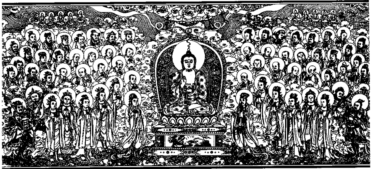
清刻龍藏佛說法變相圖