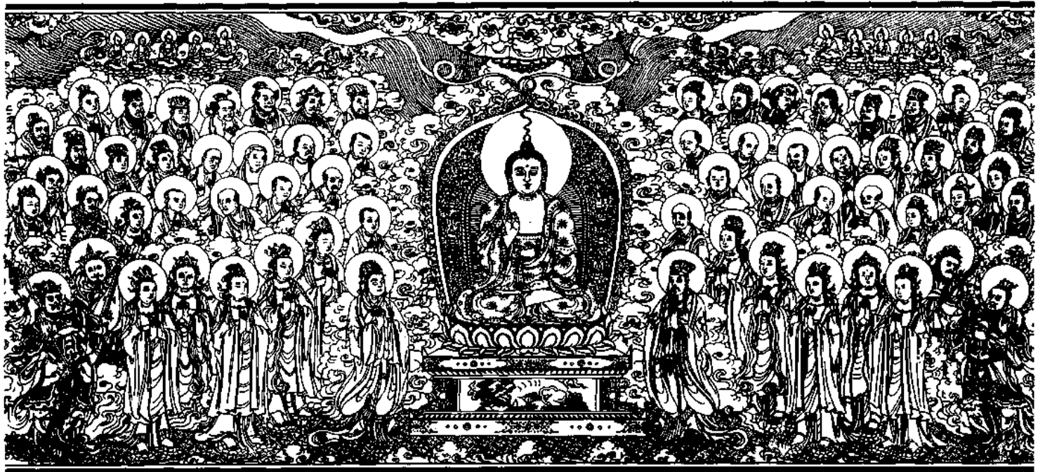
清刻龍藏佛說法變相圖