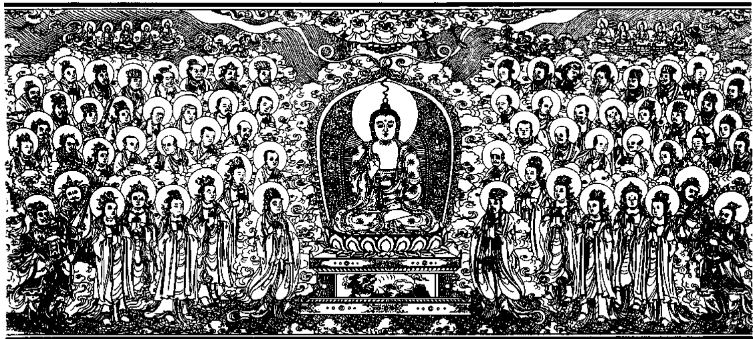
清刻龍藏佛說法變相圖