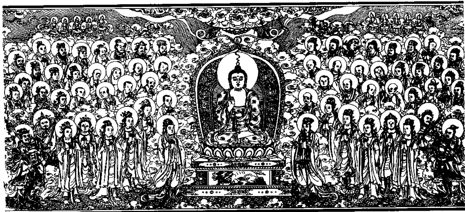
清刻龍藏佛說法變相圖