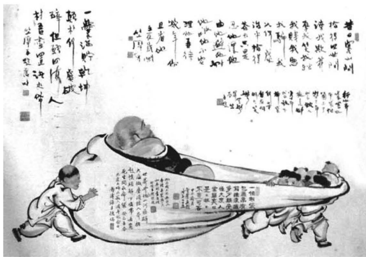
圖14：「六根清淨」 資料來源：《篆香室書畫集》馬來西亞 三慧講堂提供（2006年8月15日）

養得力。心境泰然，不入六境，逆轉塵流，自性清淨，所以不為六根的六個賊仔所害而失去種種功德法寶了。又平常人迷入六根，不見六個小孩，現在布袋和尚的六根清淨，六賊不能內擾，只好跑了出來，無法再入，所以只能在布袋外面，嬉皮笑臉地與之玩耍了。」這是菩薩們的遊戲三昧，很有人生的玩味。 113