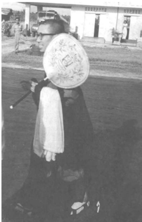
圖十一：一九五四年竺摩法師抵達檳城國際機場