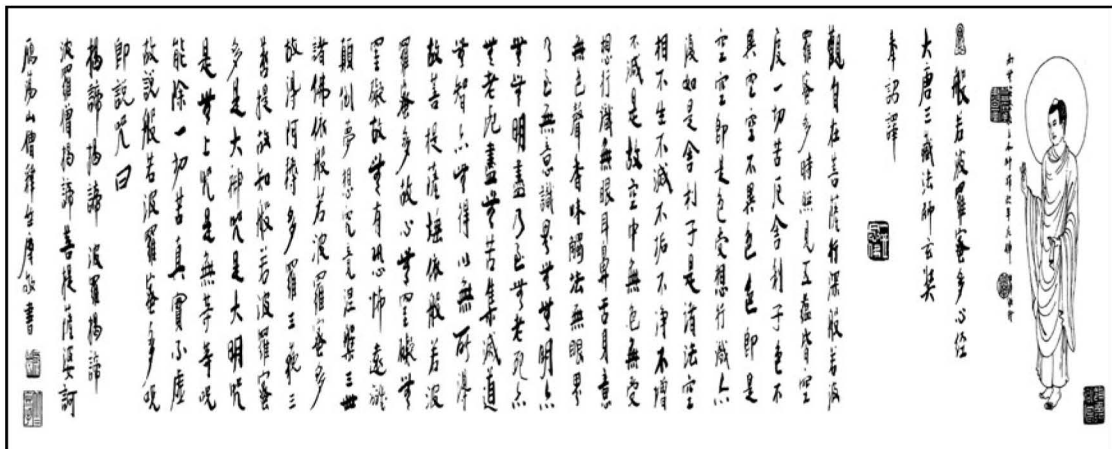
圖二十：《般若波羅蜜多心經》

篆隸行草無所不精。他融合各家筆法，寫出不食人間煙火的一體，脫俗入化，別成一格，動態形象奔忙，有書在佛門外之威。其書作飄逸而入蒼勁，豪放而又端莊，尤以各體參合，字體大小長短生動。有時他在行書中偶爾摻入一兩個甲骨文，不但不會覺得格格不入，反而相映成趣，令人