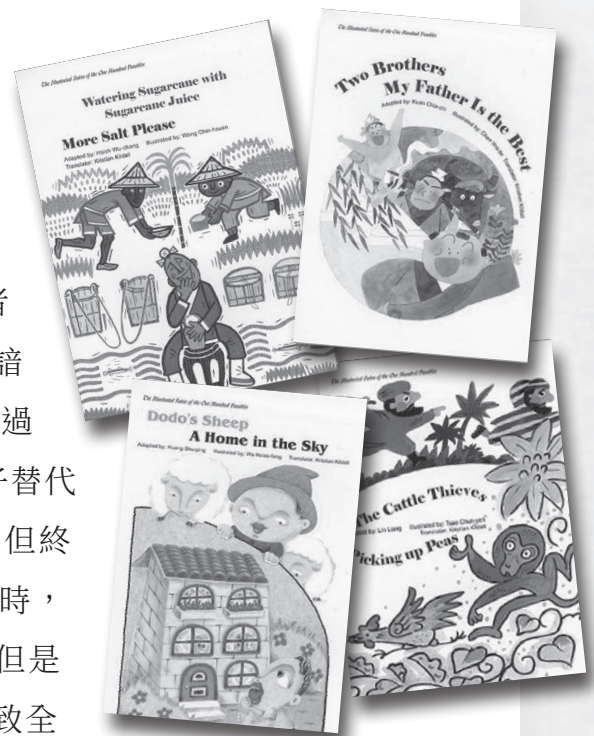
佛光文化出版的英文版《百喻經圖畫書》

如《入菩薩行論》云：「此等應身行，徒說有何益？唯誦療病方，豈益諸病者？」學習了佛陀的教法後，應該殷重而精勤地照著實修，若僅僅於文字上空談，豈能真正體驗到佛法甘露妙味？不論是世間學問，或是修學佛法，若僅僅在文字上鑽研琢磨，卻忽略了實踐與行持，口裡雖然能講得煞有其事，到了實際運用時，實無所曉卻還自言善解，隨意教他，這樣的行為，將如大長者子口誦乘船法而不解如何運用一般，最終只會引領自他走向滅亡，白白浪費了生命。🌀