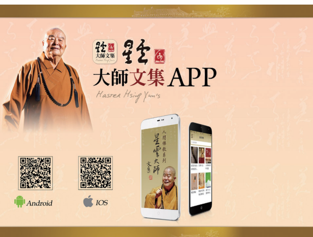
佛光山善用現代科技輔助弘法，讓佛法的傳播更便利。

師也一直注重利用現代傳媒來弘揚佛法。截止目前，佛光山有多個出版社、一個報社、多種雜誌，有內容豐富更新及時的網站，並創設了佛光元宇宙，開始與人工智慧接軌，絕不無視現代科技所提供的最新傳播方式。