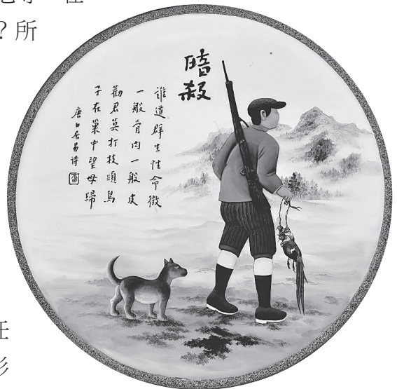
佛光山佛陀紀念館護生浮雕 -- 誰道群生性命微，一般骨肉一般皮。勸君莫打枝頭鳥，子在巢中望母歸。

豢養寵物也是現代人的時尚；然而所謂：「人在牢獄，終日愁歎；鳥在樊籠，終日悲啼；聆此哀音，淒入心脾；何如放捨，任彼高飛。」把鳥雀關在牢籠裡，形同囚犯；如此虐待動物，亦不合護生之道。因此，不虐待動物也是護