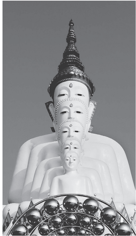
佛佛道同，每個佛國淨土都很殊勝。

所謂「佛佛道同」，在很多的經典裡，如《藥師經》說：若有人稱念東方藥師琉璃光如來的名號，一樣可以往生極樂淨土。這個道理就如同在香港大學念書，可以到香港的政府單位任職，在中文大學、