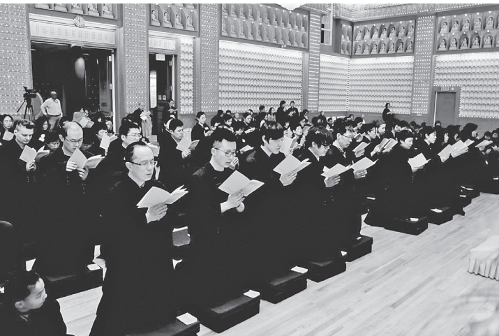
皈依三寶是成為正信佛教徒的第一步

航；黑夜中需要依靠明燈，行人才能看清方向。三寶就像我們的父母，當一個小孩被人欺侮時，雖然父母不在身邊，但是只要他叫一聲「媽媽」，別人就不敢再欺負他了，因為他有母親。同樣的，世間上邪魔外道、壞人壞事很多，有了三寶做為依靠，生命就有了安全的依怙。