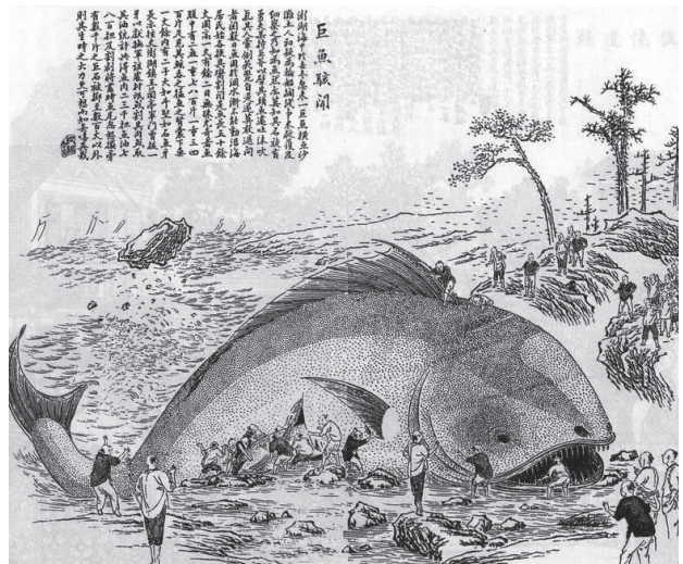
清末對巨魚的描繪。

複次，念佛三昧有大福德，能度眾生，是諸菩薩欲度眾生，諸餘三昧無如此念佛三昧福德，能速滅諸罪者。如說：昔有五百估客， 18 入海採寶；值摩伽羅 19 魚王開口，海水入中，船去駛疾。船師問樓上人：「汝見何等？」答言：「見三日 20 出，白山羅列，水流奔趣，如入大坑。」船師言：「是摩伽羅魚王開口，一是實日，兩日是魚眼，白山是魚齒，水流奔趣是入其口。我曹了矣！各各求諸天神以自救濟！」是時諸人各各求其所事，都無所益。中有五戒優婆塞語眾人言：「吾等當共稱南無佛，佛為無上，能救苦厄！」眾人一心同聲稱南無佛。是魚先世是佛破戒弟子，得宿命智，聞稱