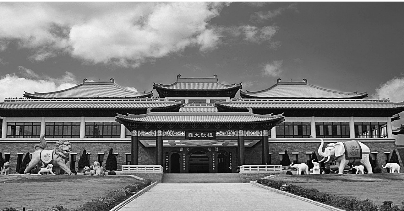
佛陀紀念館禮敬大廳前的左雄獅、右大象，代表解行並重、福慧共修。

禮敬大廳外觀宛如一座城堡，建坪約 5,000 平方公尺（1,400 坪），地下一層，地上三層。一樓大廳有服務台、文物流通處、店