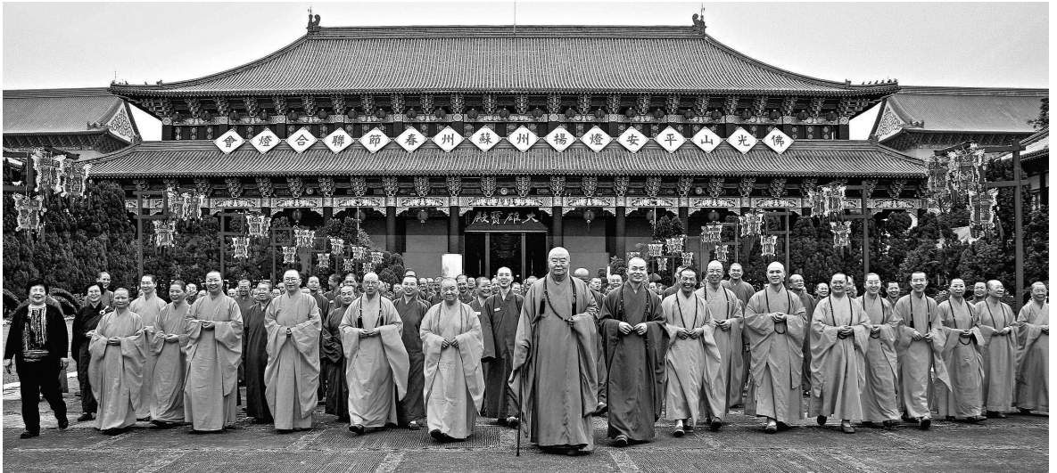
大師與佛光山四眾弟子

我想，性別上雖然有男女之別，但是佛性上沒有所謂男女的劃分，當中是沒有差距的。所以在佛光山的兩性管理上，例如上殿、過堂、排班，都是男眾在東單、女眾在西單，東西各分一半，沒有