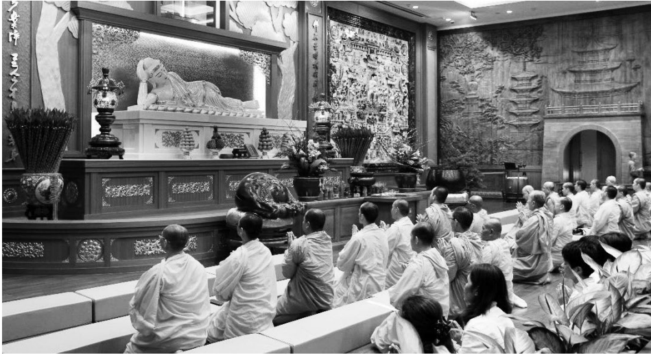
來自世界各地人士至佛陀紀念館玉佛殿參拜佛陀真身舍利

觀音殿」，以及「金佛殿」與「玉佛殿」。金、玉佛殿中，佛館的建設象徵南、北傳佛教的融合，分別供奉著泰國僧王所贈送的金佛，以及產自緬甸珍奇白玉雕刻而成的臥佛。