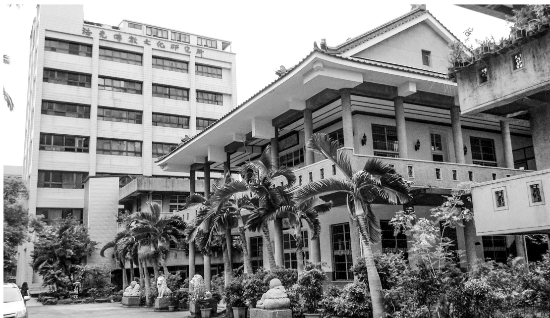
法光寺與法光佛教文化研究所。