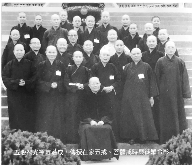
五股智光禪寺落成，傳授在家五戒、菩薩戒時與徒眾合影。