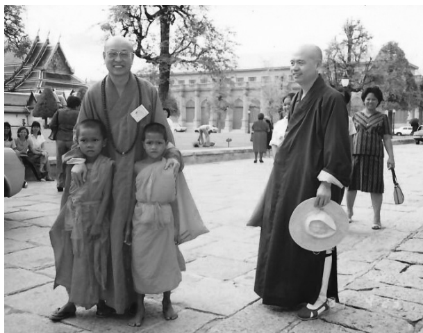
1987年中國佛教會東南亞訪問團，了中老和尚（右）與廣元長老分別擔任團長、副團長。

同年11月28日，成立「中國佛教會印度、斯里蘭卡朝聖團」，我又擔任副團長；後來又一起參訪大陸峨嵋山，一起担任三師傳戒，一起拜會諸山長老，一起推動佛教事務，……。